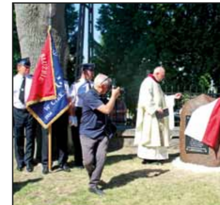
Odsłonięcie tablicy upamiętniającej bohaterów poległych w sierpniu 1920 r. na terenie Ciekusyna