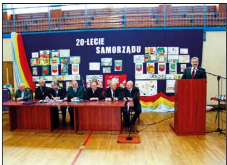
Uroczyste obchody 20-lecia samorządu terytorialnego w Gminie Nasielsk