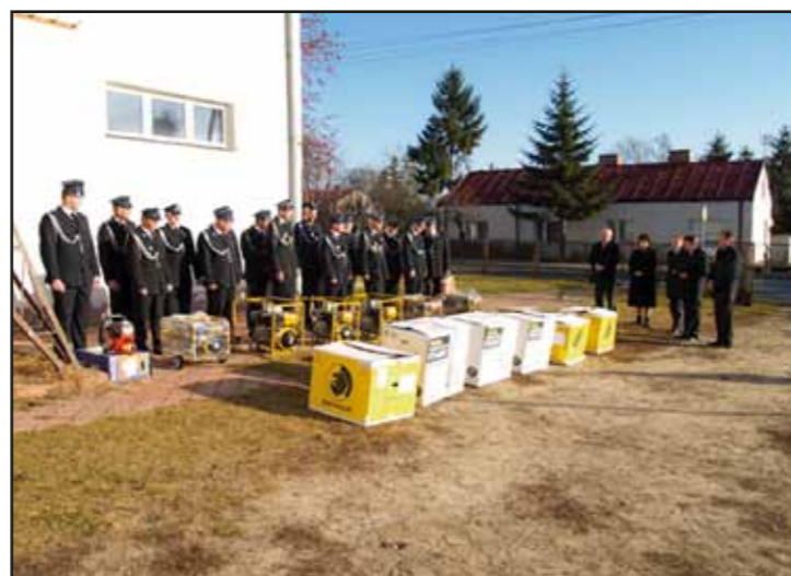
Przekazanie sprzętu specjalistycznego dla Ochotniczej Straży Pożarnej w Nasielsku