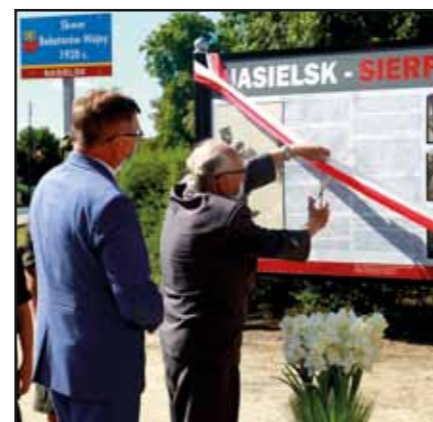
Odsłonięcie tablicy przy skwerze Bohaterów Wojny 1920 r. upamiętniającej wydarzenia z sierpnia 1920 r.