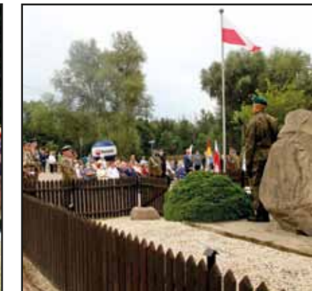
Uroczystości w Borkowie upamiętniające 100-lecie Bitwy nad Wkrą