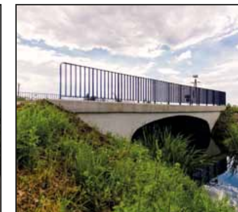
Przebudowa mostu przy ul. Podmiejskiej