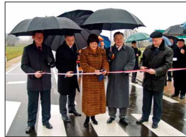
Odbiór drogi w Popowie