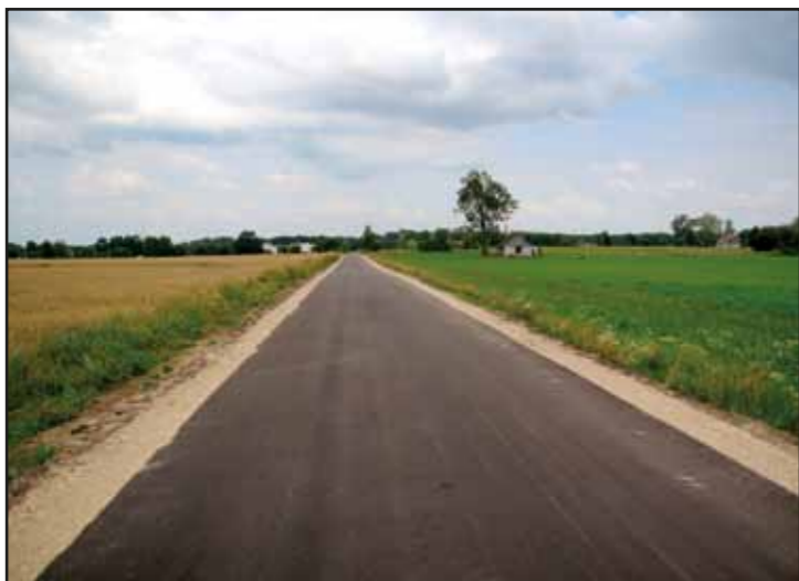
Droga w Krzyczkach-Żabiczkach