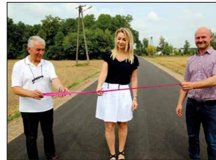
Odbiór drogi w Paulinowie