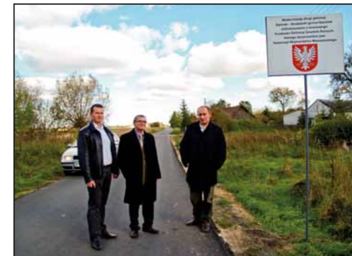
Droga Dębinki – Studzianki