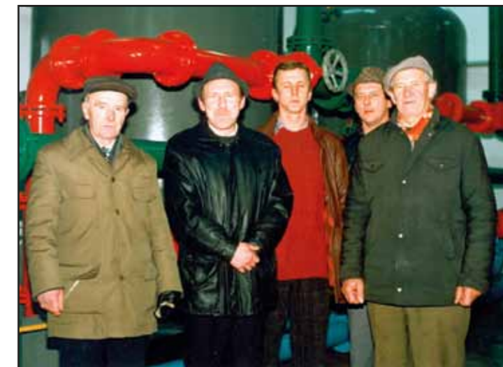
Uruchomienie Stacji Uzdatniania Wody w Psucinie