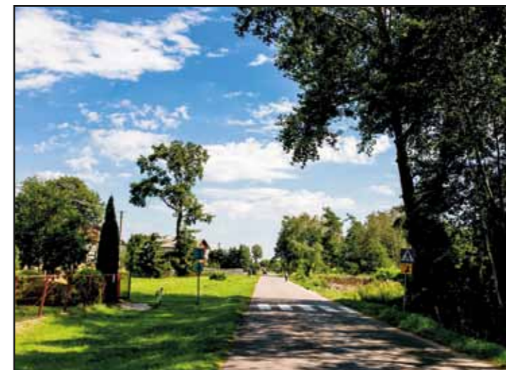
Modernizacja drogi Dębinki – Studzianki