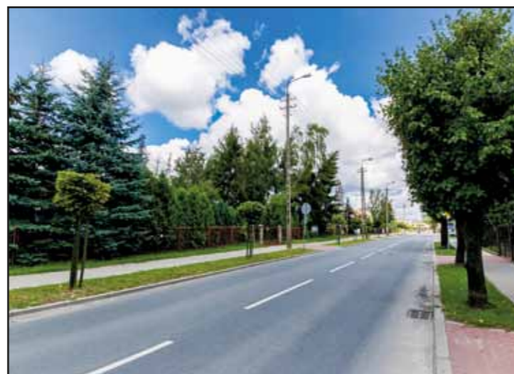
Budowa kanalizacji sanitarnej w ul. P.O.W. w Nasielsku

nior+” udało się wykonać prace adaptacyjno-remon-towe w budynku przy ul. Warszawskiej 52. Dzięki inwestycji osoby 60+ zyskały miejsce do spotkań oraz aktywnego spędzania czasu. W obiekcie oprócz kuchni, łazienki, toalety i pralni znajduje się pomieszczenie wyposażone w specjalistyczny sprzęt do ćwiczeń. Uroczyste otwarcie nastąpiło 15 listopada 2017 r., a 21 stycznia 2019 r. Klub Senior+ odwiedziła Pani Elżbieta Rafalska – Minister Rodziny, Pracy i Polityki Społecznej, która wraz z seniorami świętowała Dzień Babci i Dziadka,