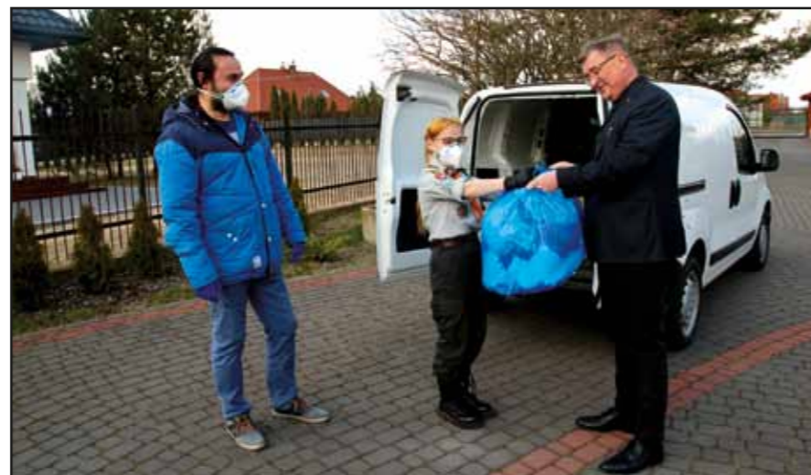
Przekazanie maseczek ochronnych w Gminie Nasielsk