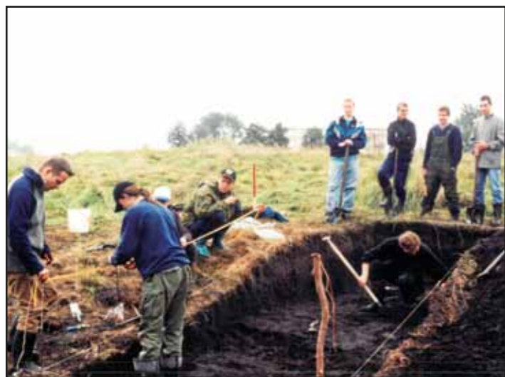
Badania archeologiczne prowadzone przez Instytut Archeologii i Etnologii Polskiej Akademii Nauk oraz Wyższą Szkołę Humanistyczną w Pułtusku

W 2001 r. w Gminie Nasielsk zarejestrowanych jest 940 podmiotów prowadzących działalność gospodarczą. W podziale na poszczególne branże obraz ten wygląda następująco: 173 sklepy spożywcze i 101 jednostek zajmujących się handlem produktami spożywczymi, ale w formie obwoźnej; handel artykułami przemysłowymi prowadzą 162 sklepy, a 53 osoby działają w handlu obwoźnym; usługi w zakładach stacjonarnych prowadzi 71 podmiotów, a 336 prowadzi tę działalność w terenie. W branży produkcyjnej zarejestrowanych jest 86 podmiotów.