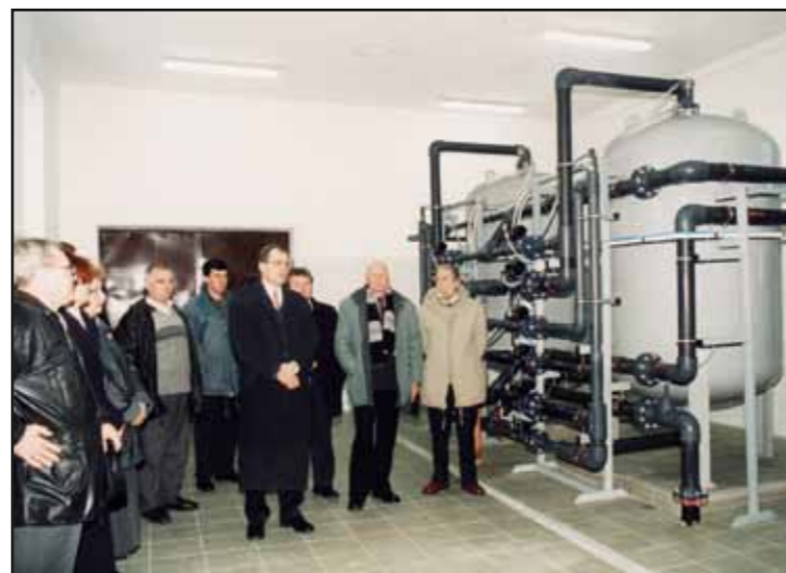
Uroczyste otwarcie Stacji Uzdatniania Wody w Ciekosynie