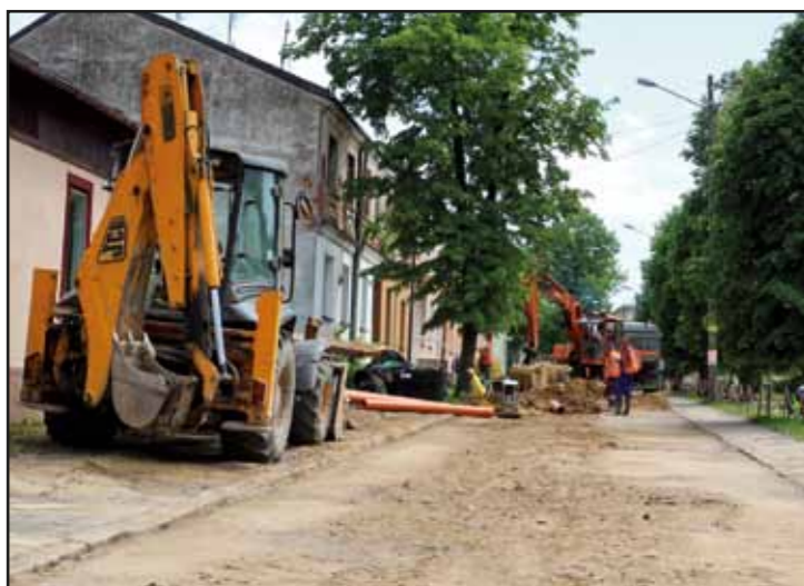
Budowa kanalizacji sanitarnej w centrum Nasielska