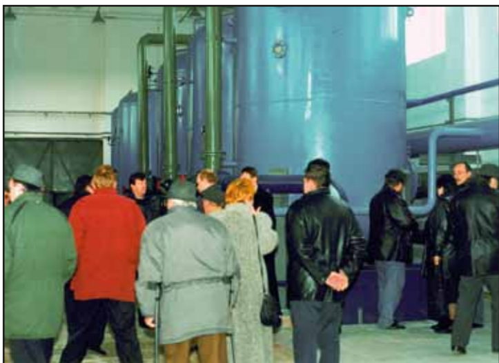
Otwarcie Stacji Uzdatniania Wody w Jackowie