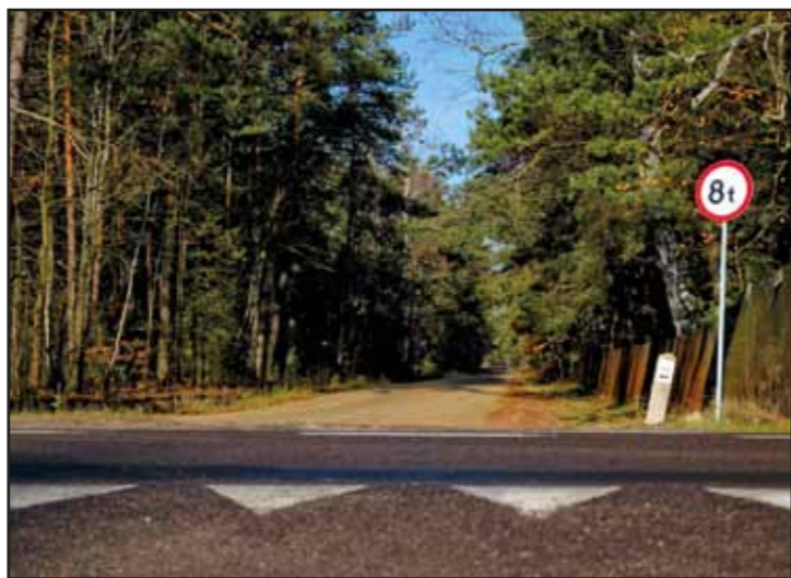
Czarny szlak rowerowy o długości 24 km stworzony we współpracy z PTTK