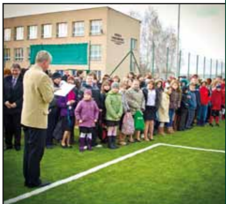
Uroczyste otwarcie kompleksu boisk sportowych w ramach programu „Moje boisko – Orlik 2012” w Nasielsku, ul. Kościuszki 21