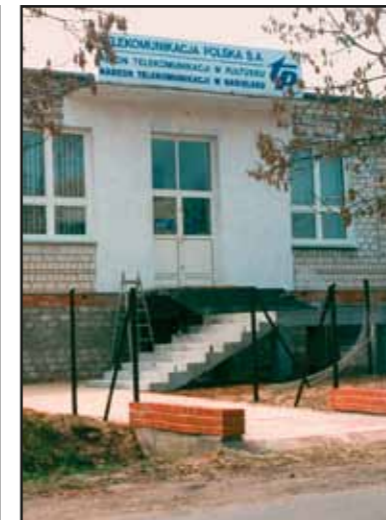
Uruchomienie centrali telefonicznej