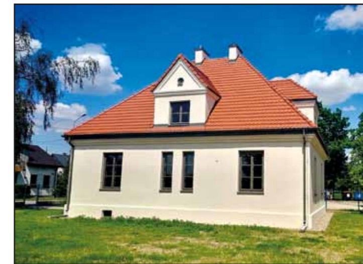
Wyremontowany Dom Nauczyciela