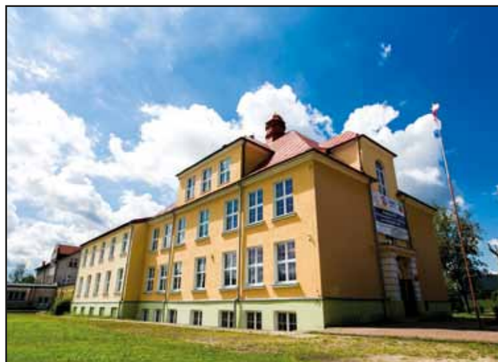
Termomodernizacja Szkoły Podstawowej nr 1 w Nasielsku