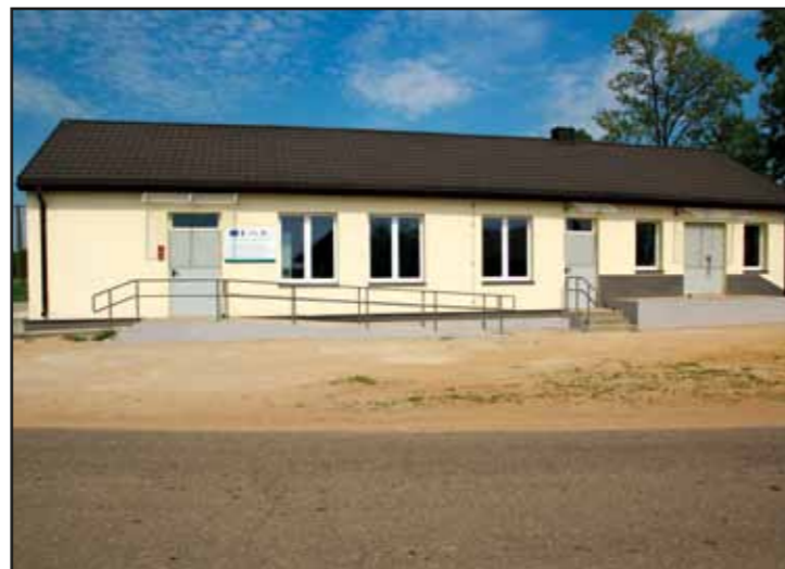
Adaptacja istniejącego budynku na miejsce spotkań i integracji mieszkańców w Krzyckach-Żabiczkach