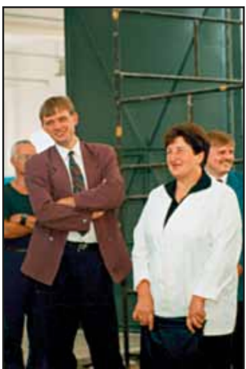
Otwarcie Stacji Uzdatniania Wody w Jackowie