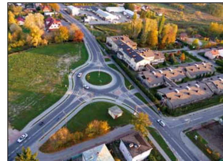
Rondo na skrzyżowaniu ul. T. Kościuszki i Płońskiej w Nasielsku