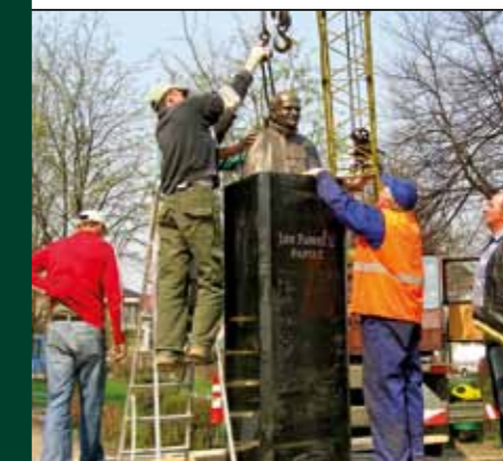
Budowa pomnika Jana Pawła II