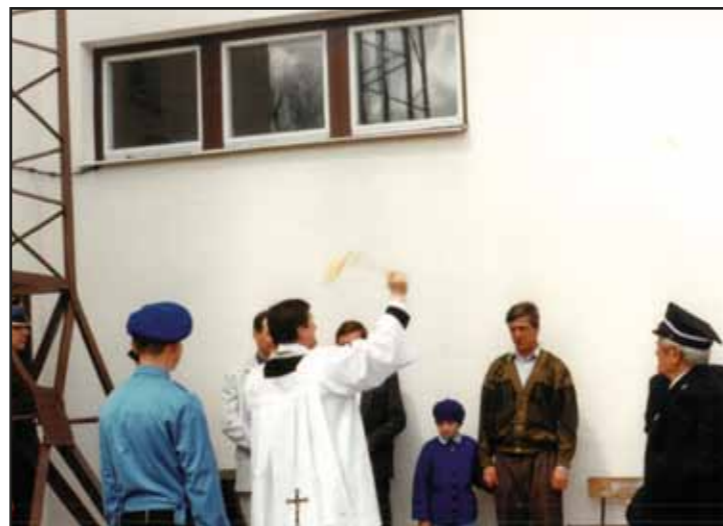
Wyświęcenie strażnicy w Nasielsku