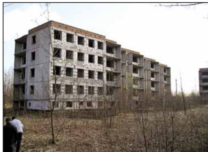
Adaptacja bloków przy ul. Płońskiej