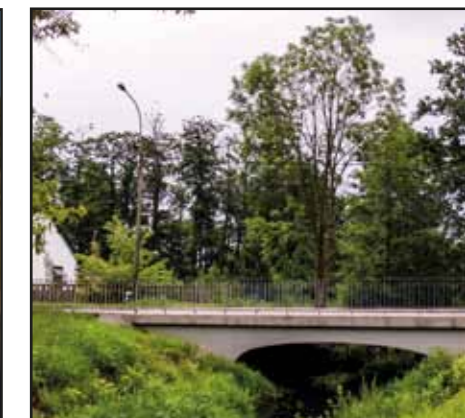
Przebudowa mostu na rzece Nasielnej w Nasielsku – ul. Żwirki i Wigury