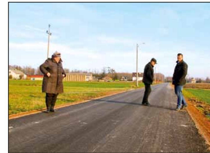
Modernizacja drogi w Mogowie