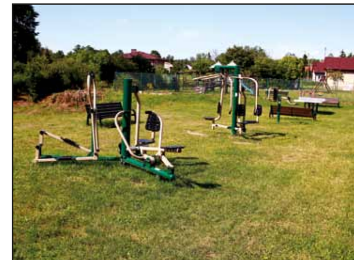
Otwarta Strefa Aktywności w Ciekusynie