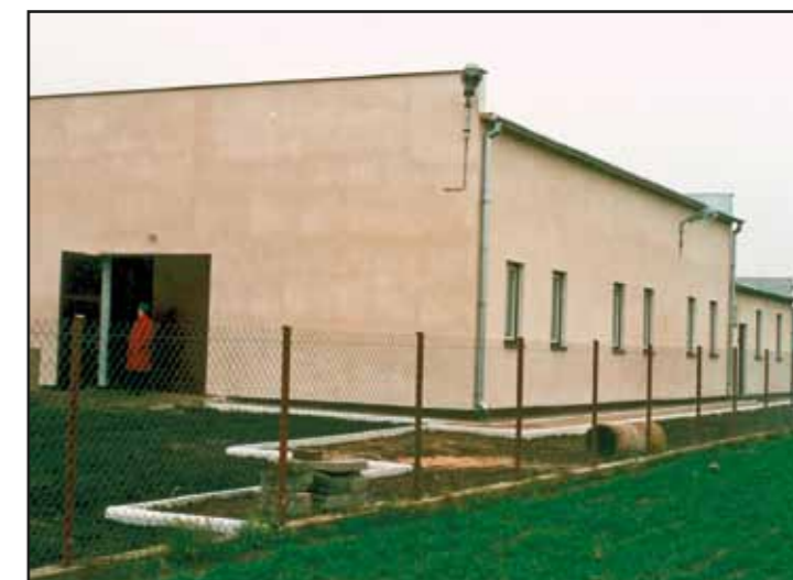
Stacja Uzdatniania Wody w Psucinie