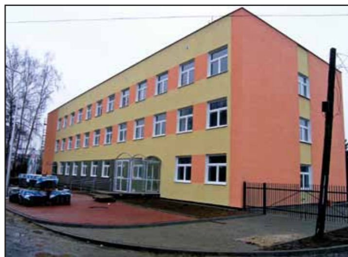
Nowa siedziba Urzędu Miejskiego w Nasielsku przy ul. Elektronowej