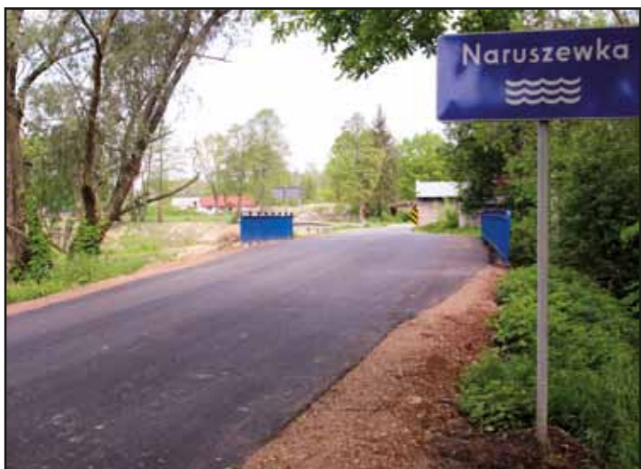
Droga w Dobrej Woli