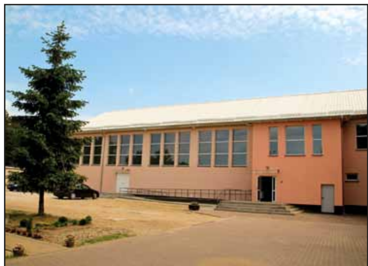
Nowoczesna sala gimnastyczna przy Szkole Podstawowej w Budach Siennickich