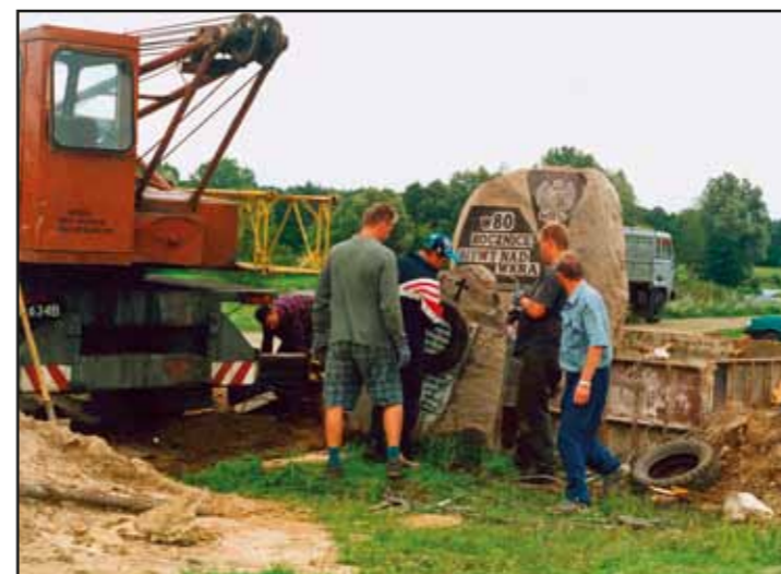
Budowa pomnika w Borkowie, 2000 r.