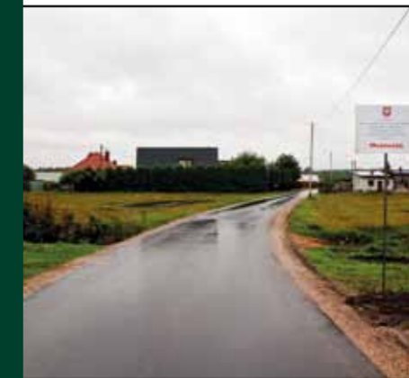
Modernizacja drogi w Miękoszynku