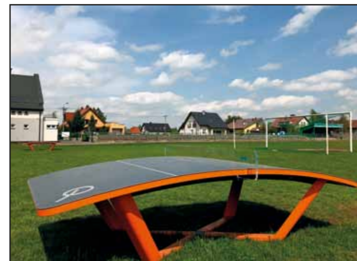
Stół do Teqball