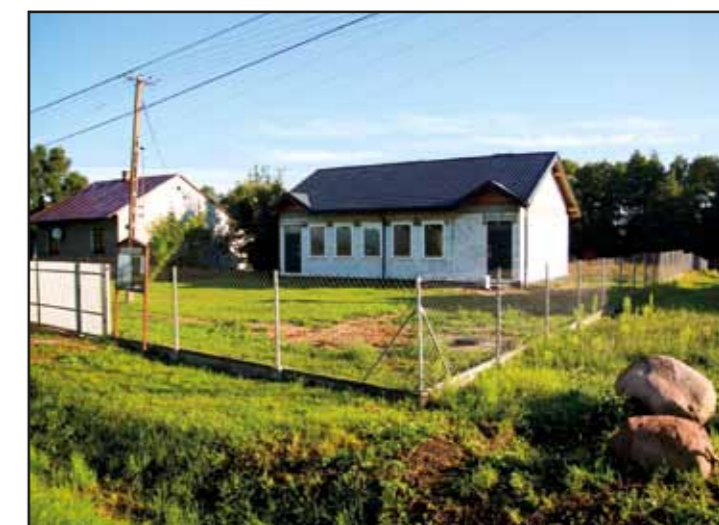
Modernizacja świetlicy wiejskiej w Mazewie Dworskim „A”