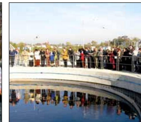
Otwarcie oczyszczalni ścieków w Nasielsku