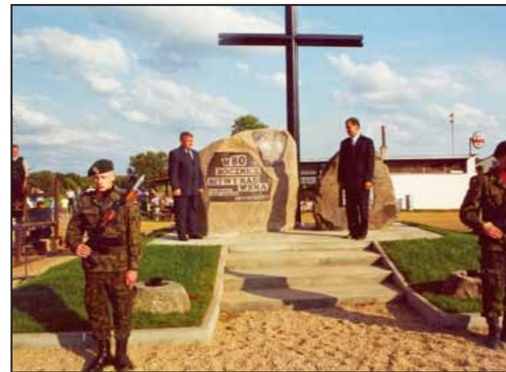
Pomnik w Borkowie