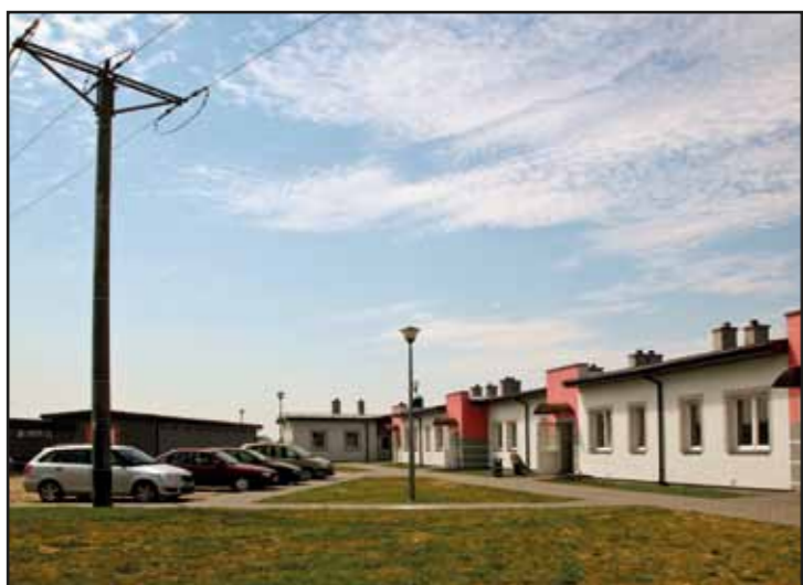
Mieszkania socjalne wraz z infrastrukturą zewnętrzną w Chrcynnie