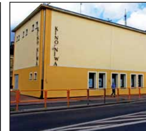
Termomodernizacja budynku Nasielskiego Ośrodka Kultury