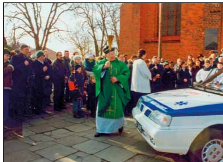
Uroczyste przekazanie lokalnej społeczności Gminy Nasielsk karetki pogotowia