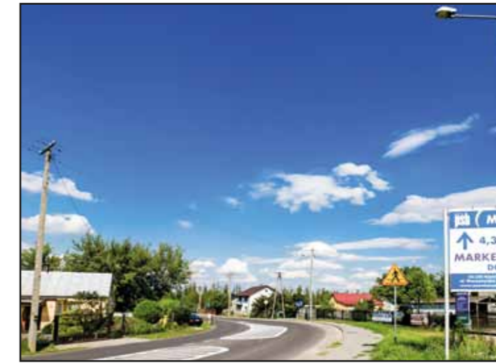
Oświetlenie uliczne w Pieścirogach