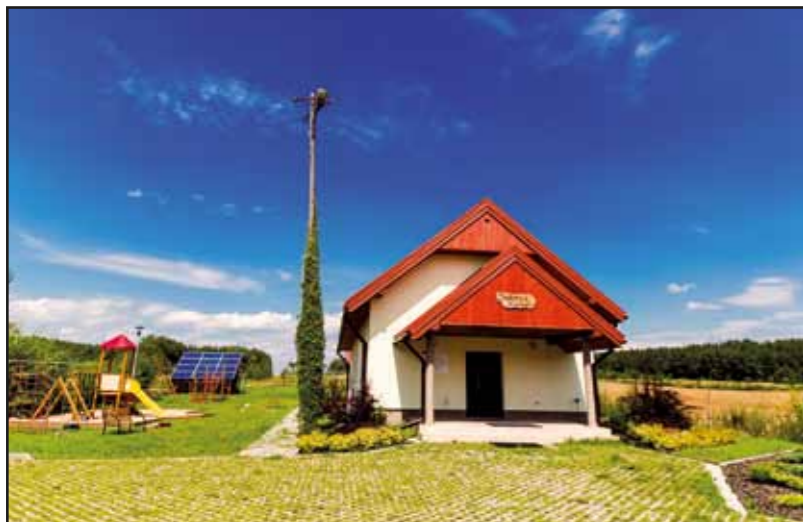
Wyremontowana świetlica wiejska w Konarach