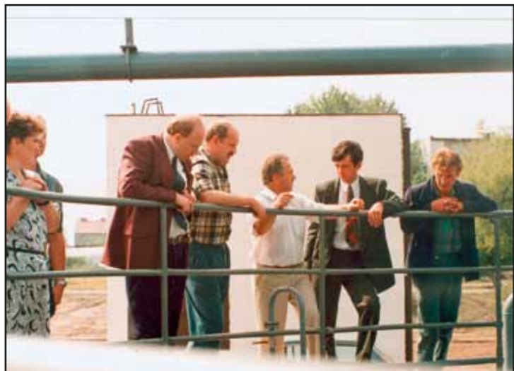
Oczyszczalnia ścieków dla wschodniej części miasta

Toczono rozmowy z przedstawicielami gmin: Serock, Pokrzywnica, Pomiechówek, Skrzyszew i Nieporęt, odnośnie utworzenia związku gmin, który miałby zajmować się wspólną organizacją wydatków komunalnych tj. wysypisko i utylizacja śmieci, drogi czy wodociągi.