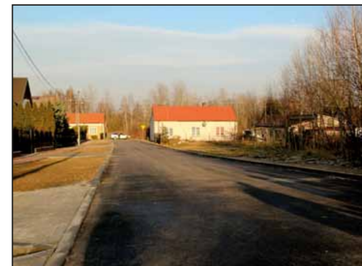
Modernizacja ul. Leszczynowej w Starych Pieścirogach