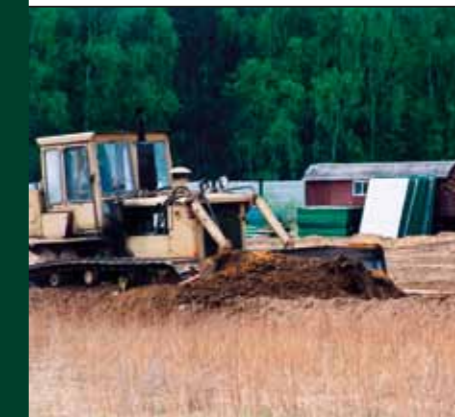
Budowa międzygminnego wysypiska odpadów komunalnych w Jaskółowie