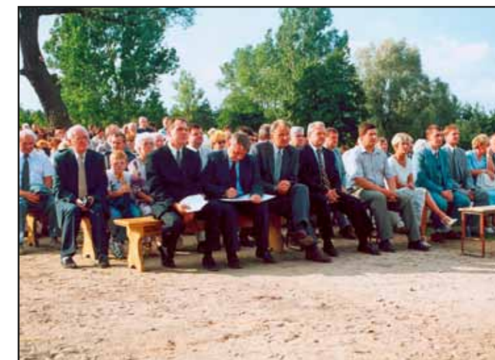
Uroczystość 15 sierpnia 2000 r. w Borkowie