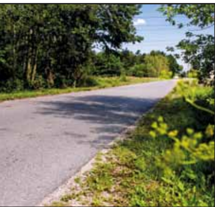
Modernizacja drogi gminnej na odcinku Paulinowo – Siennica