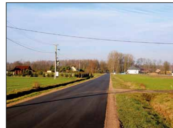
Modernizacja drogi w Jackowie Dworskim