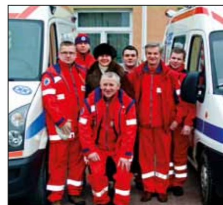
Uroczyste przekazanie dwóch karetek (pogotowia ratunkowego i przewozowej) dla Samodzielnego Publicznego Zakładu Opieki Zdrowotnej w Nasielsku