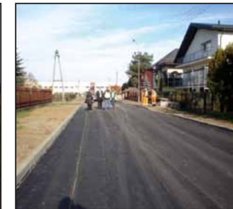
Modernizacja ul Wiśniowej w Nasielsku