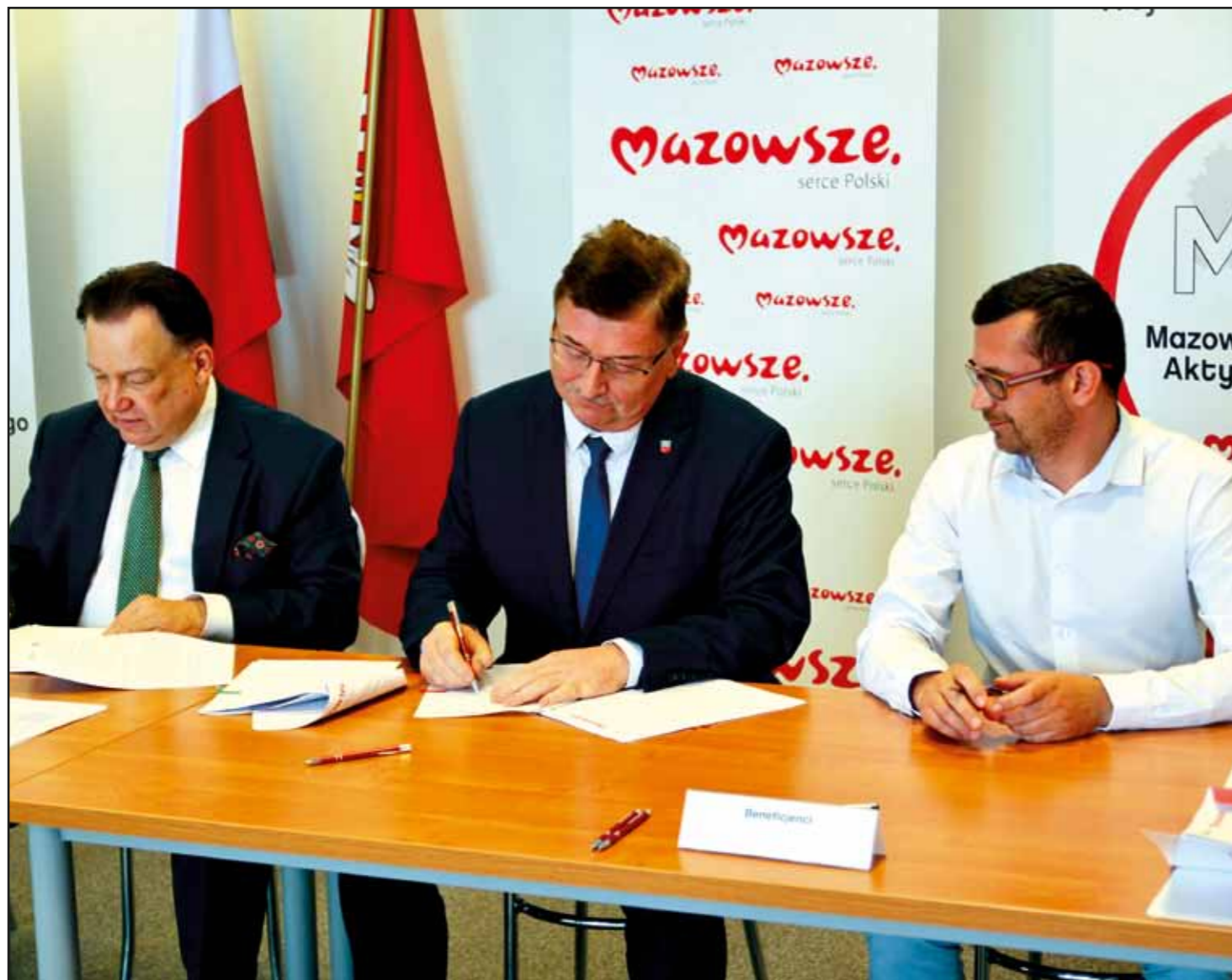
Podpisanie umów w ramach: Mazowieckiego Instrumentu Aktywizacji Sołectw 2020 (80 000 zł) oraz Mazowieckiego Instrumentu Wsparcia Ochrony Powietrza (150 000 zł)