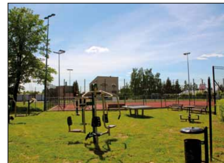
Otwarta Strefa Aktywności w Nasielsku