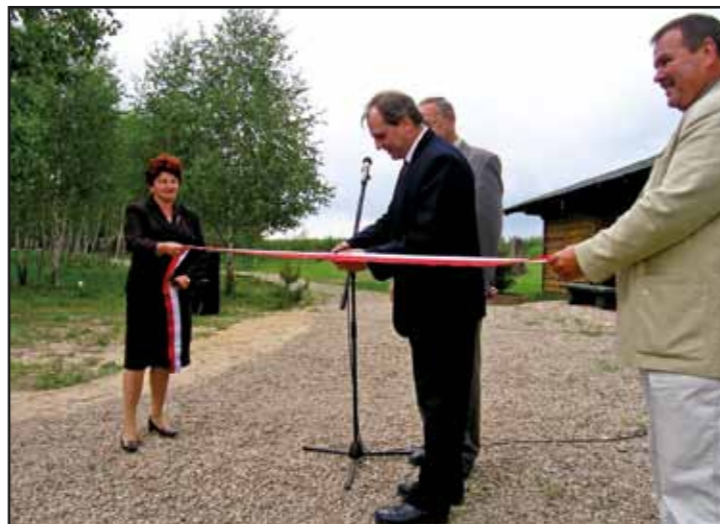
Otwarcie ścieżki ekologicznej na Wysypisku Odpadów Komunalnych w Jaskółowie