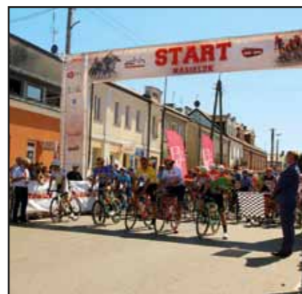
Międzynarodowy wyścig kolarski Tour Bitwa Warszawska 1920 z okazji 100-lecia Bitwy nad Wkrą