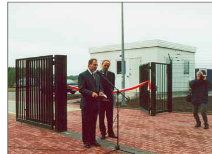
Otwarcie składowiska odpadów w Jaskółowie