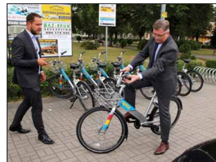
Prezentacja systemu Nasielski Rower Miejski

rania sołtysów na rzecz lokalnej społeczności, 17 sołectw dało szansę wykazać się nowym osobom,