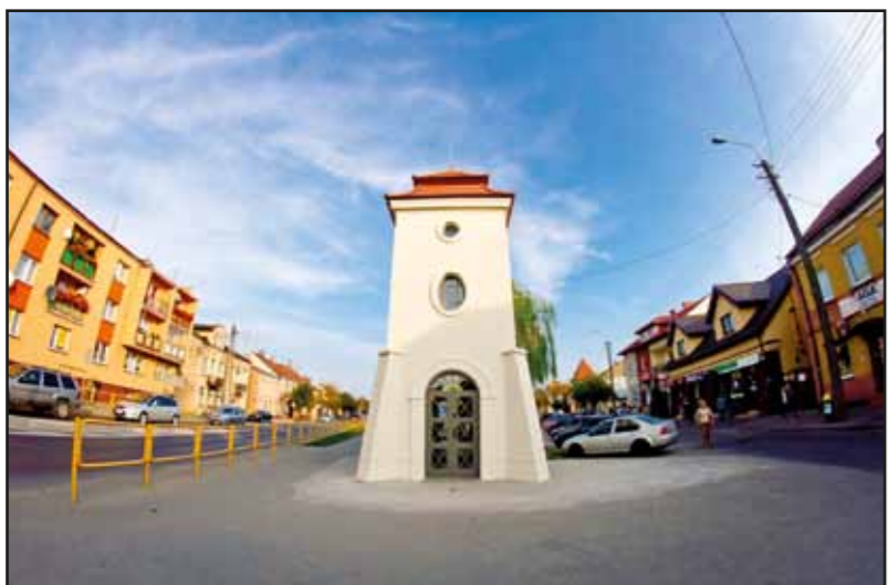
Zmodernizowany budynek zabytkowej Baszty w Nasielsku