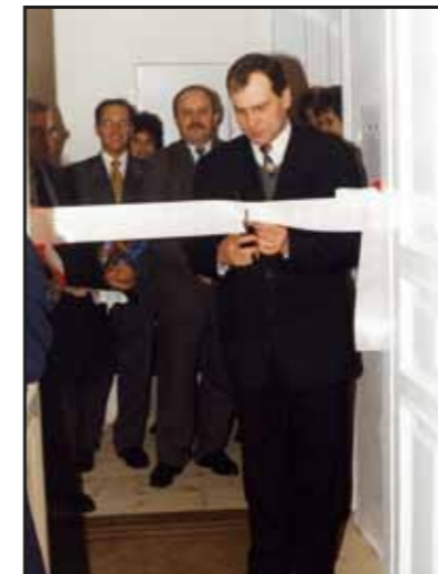
Uroczyste otwarcie Biblioteki Miejskiej