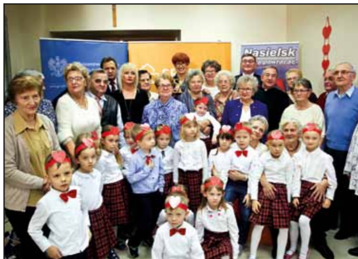
Dzień Babci i Dziadka w klubie Senior+