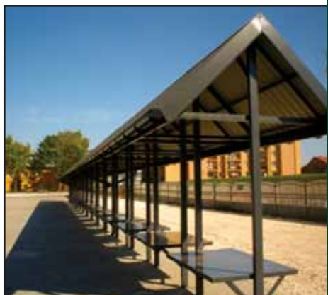
Przebudowa targowiska miejskiego