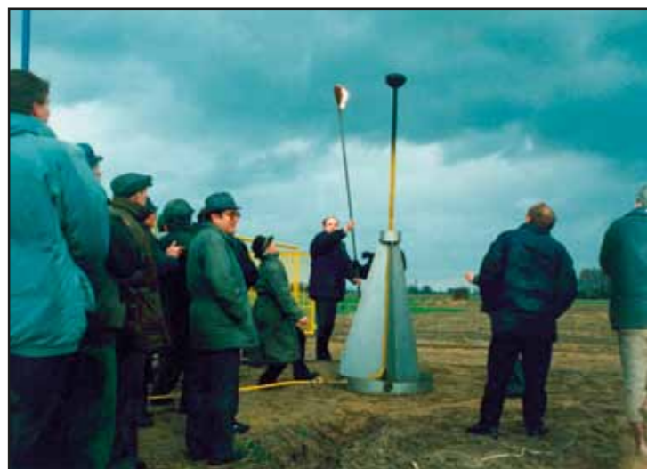
Rozpoczęcie gazyfikacji gminy