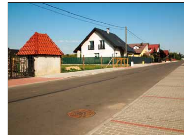
Wykonanie chodników i nawierzchni asfaltowej przy ul. Dębowej w Nasielsku