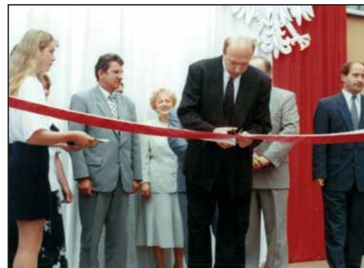
Zespół Szkół Zawodowych zyskuje nowy budynek szkolny

chanowskiego pozytywnie zaopiniował propozycję podziału Miasta i Gminy Nasielsk na część wiejską i miejską.