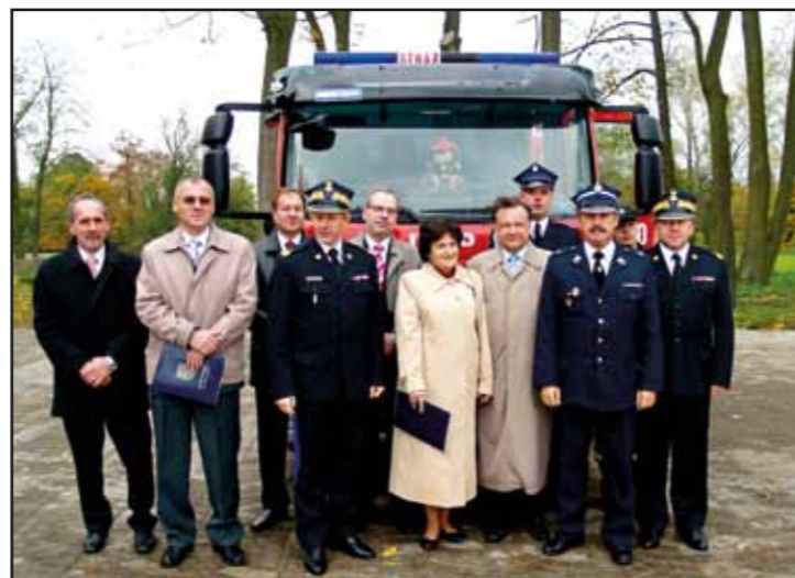
Przekazanie wozu strażackiego dla OSP Nasielsk