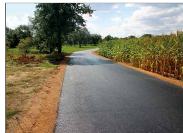
Modernizacja drogi w Winnikach