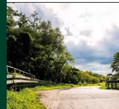
Przebudowa mostu przy ul. Pniewska Górka