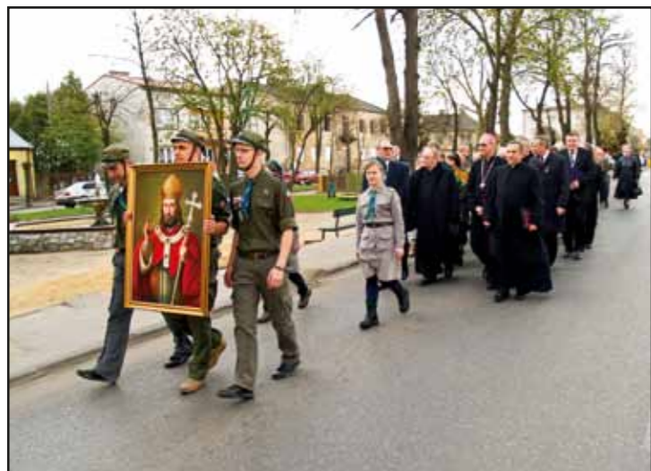
Święto Patrona Miasta Nasielska – św. Wojciecha