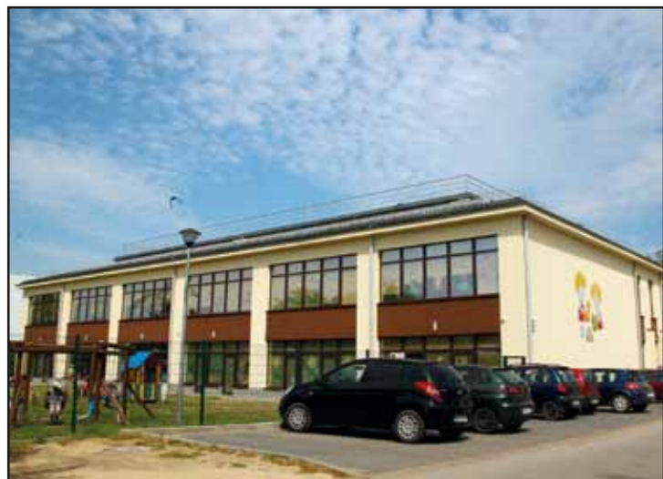
Nowoczesny budynek Samorządowego Przedszkola i Żłobka Miejskiego w Nasielsku