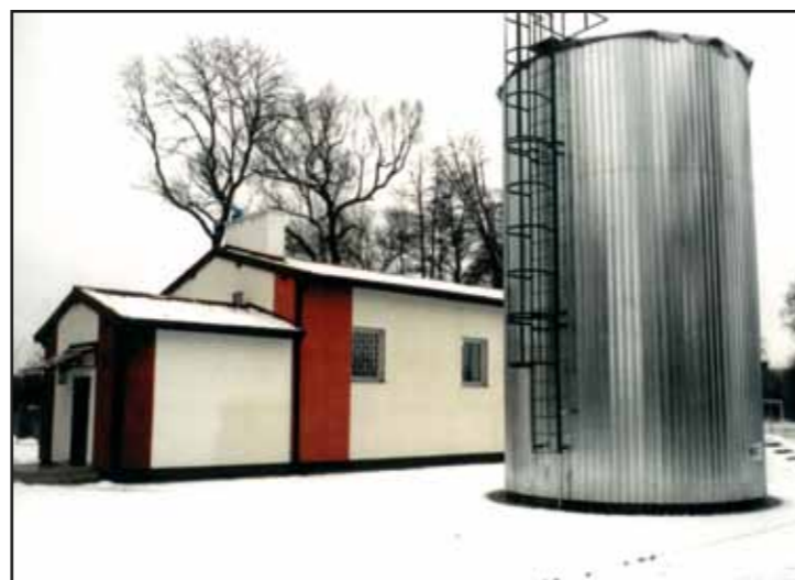
Stacja Uzdatniania Wody w Ciekosynie