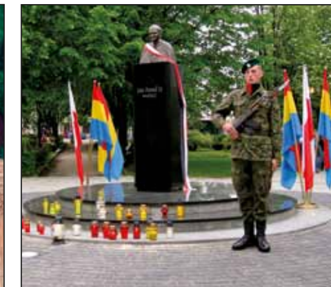
Odsłonięcie pomnika Jana Pawła II