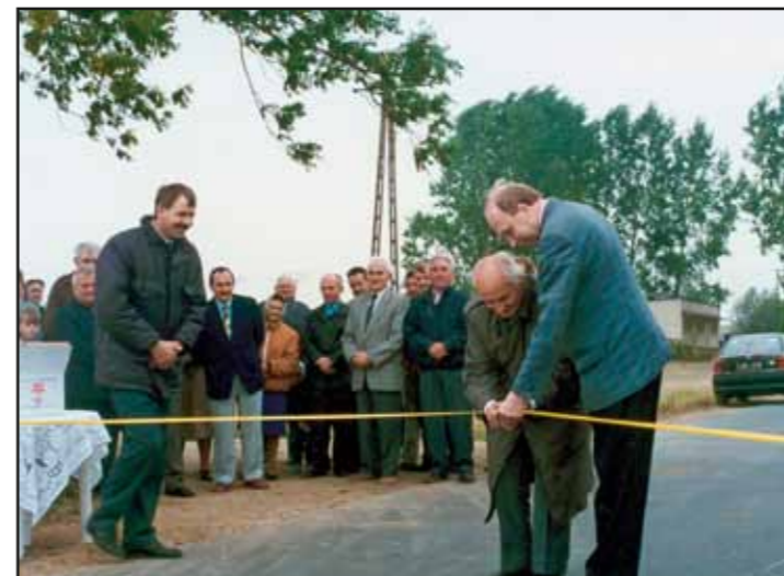
Uroczystość oddania do użytku wyremontowanej drogi w Jackowie