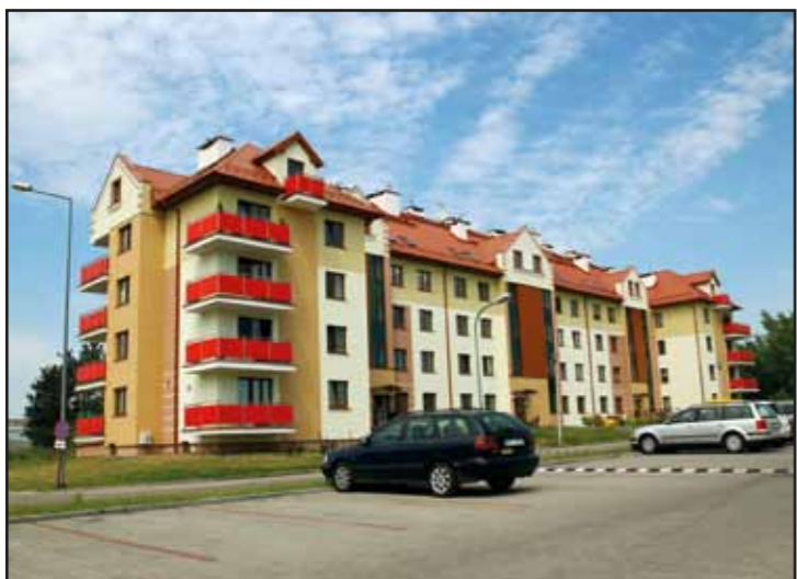
Nowoczesny wielorodzinny budynek mieszkalny „Płońska 24 D”