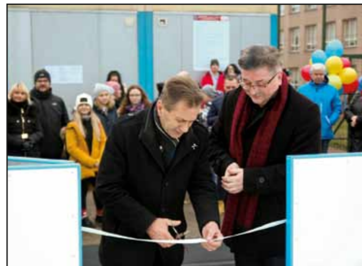
Oficjalne otwarcie sztucznego lodowiska przy SP im. Stefana Starzyńskiego w Nasielsku