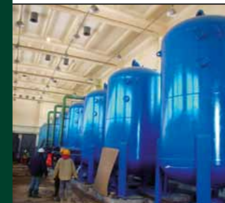
Modernizacja Stacji Uzdatniania Wody w Jackowie Włociańskim