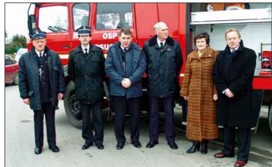
Uroczyste przekazanie wozu strażackiego dla jednostki OSP w Pscinie