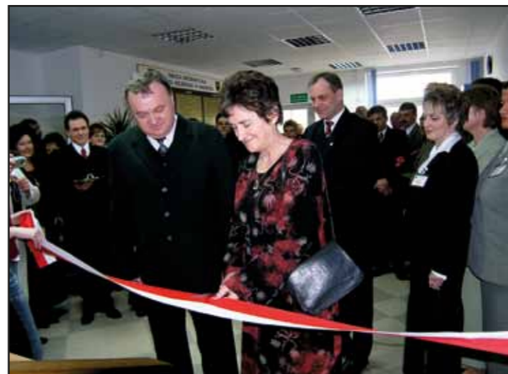
Uroczyste otwarcie nowej siedziby Urzędu Miejskiego w Nasielsku