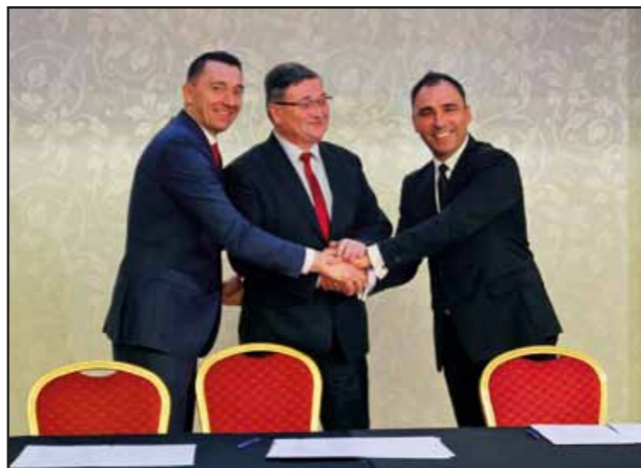
Podpisanie przez Burmistrza Nasielska porozumienia w sprawie partnerstwa międzypowiatowego