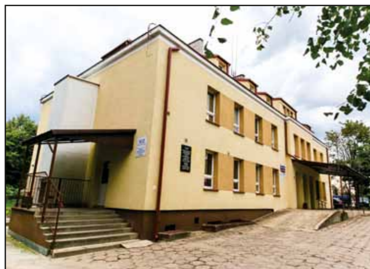
Termomodernizacja Samodzielnego Zakładu Opieki Zdrowotnej w Nasielsku