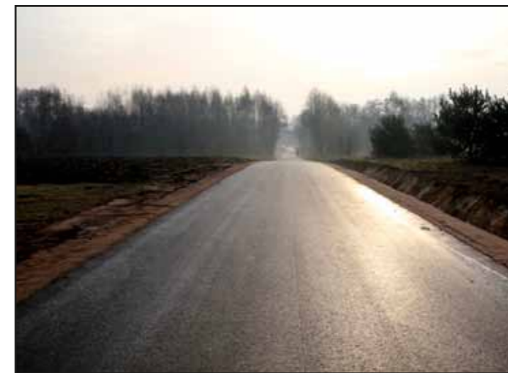
Modernizacja drogi w Pniewskiej Górcie