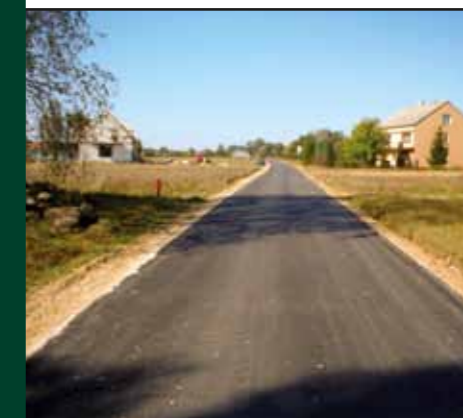
Modernizacja drogi Jackowo Włociańskie – Broninek