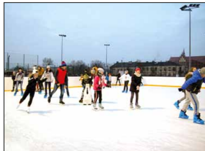
Sztuczne lodowisko przy SP im. Stefana Starzyńskiego w Nasielsku

powo Borowe, Lorcin, Żabiczyn, Paulinowo, Siennicę, Stare Pieścirogi, Mogowo PKP Nasielsk, Nowe Pieścirogi, Morigi, Czajki, Lelewo i Cieksyn, kończąc się na cieksyńskim PKP,