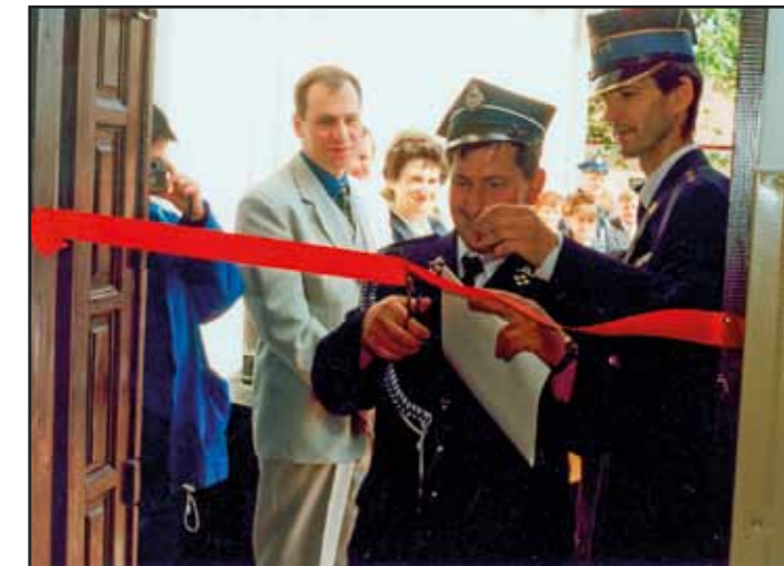
Otwarcie nowego budynku OSP w Nasielsku