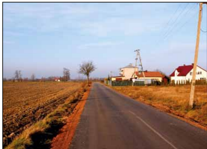
Modernizacja drogi w Studziankach