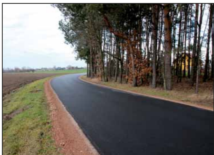
Modernizacja drogi Toruń Dworski – Zaborze