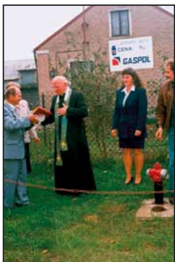
Uroczystość poświęcenia wodociągu w Żabiczynie