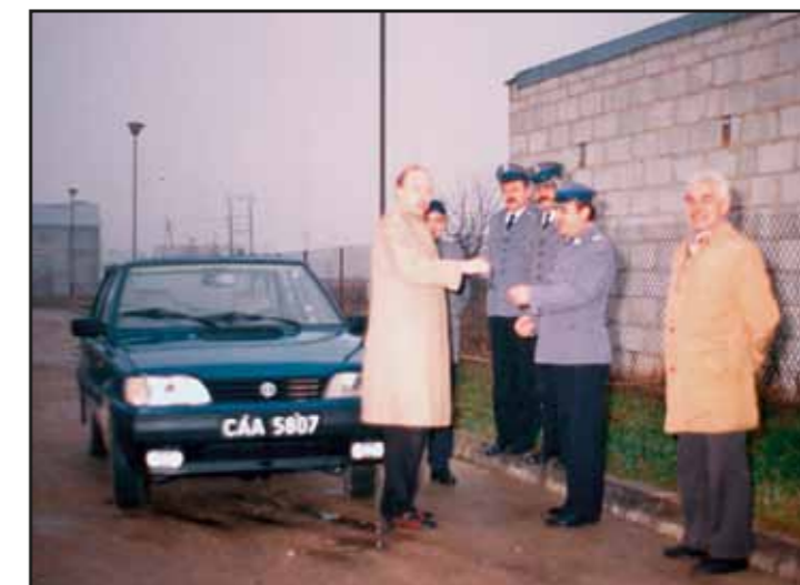
Przekazanie zakupionego przez Gminę Nasielsk samochodu dla Policji