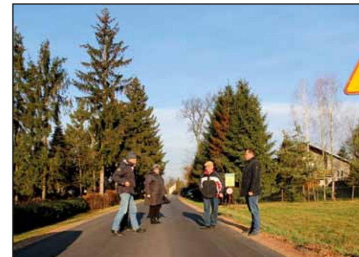
Modernizacja drogi w Mazewie Dworskim „B”