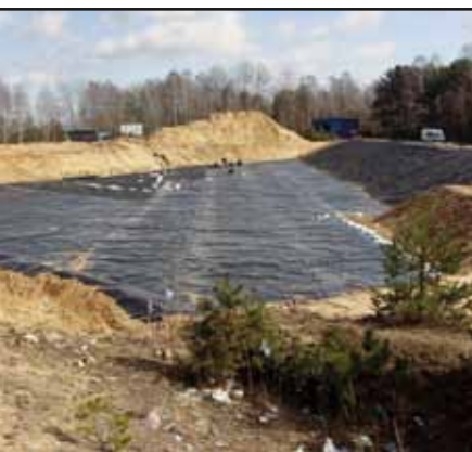
II kwaterna składowiska odpadów innych niż niebezpieczne w Jaskółowie