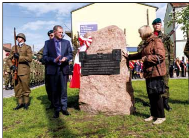
Odsłonięcie tablicy pamiątkowej na Skwerze im. kpt Antoniego Sochaczewskiego