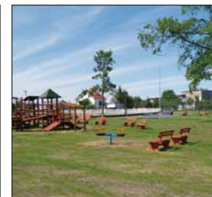
Skate-park w Starych Pieścirogach

urządzenie placu pod teren sportowo-rekreacyjny wraz z placem zabaw dla dzieci w Starych Pieścirogach gm. Nasielsk” – powstał tzw. skate-park w Starych Pieścirogach,