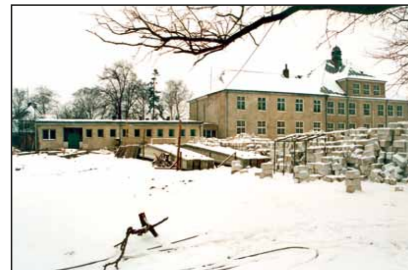
Budowa hali sportowej przy Szkole Podstawowej nr 1 w Nasielsku