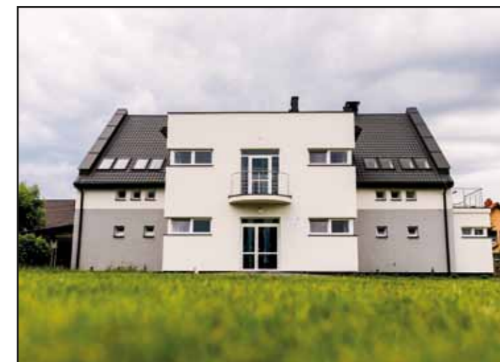
Budynek Stadionu Miejskiego przy ul. Sportowej w Nasielsku