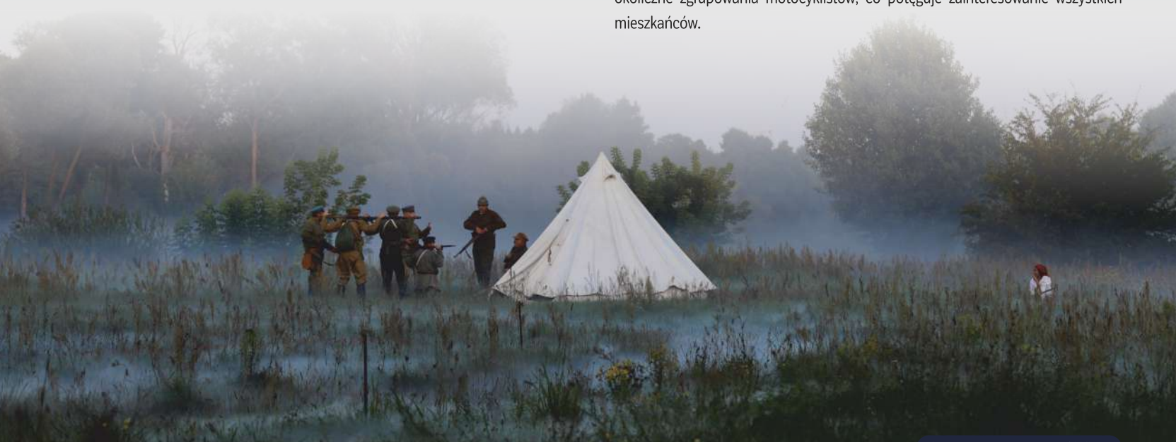
Inscenizacja Bitwy nad Wkrą

Sierpień to miesiąc patriotów i bohaterstwa. Każdego roku 1 sierpnia świętujemy rocznicę wybuchu Powstania Warszawskiego. Od ponad dwudziestu lat staramy się przypominać mieszkańcom wydarzenia Bitwy o Nasielsk oraz Bitwy nad Wkrą. Bierzymy udział w uroczystościach na cmentarzu parafialnym i w kościele w Nasielsku, a w Borkowie przy pomniku bohaterów odbywa się msza polowa z udziałem Kompanii Honorowej oraz rekonstrukcja bitwy, którą uwielbiają oglądać mieszkańcy i goście w każdym wieku. Dzień później mieszkańcy sołectwa Ciekosyn zapraszają na upamiętnienie bohaterów 22. i 201. Pułku piechoty poległych w sierpniu 1920 roku właśnie na tym terenie. W to wydarzenie cyklicznie włączają się okoliczne zgrupowania motocyklistów, co potęguje zainteresowanie wszystkich mieszkańców.