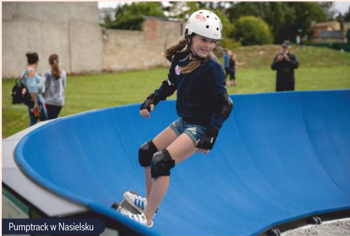
Pumptrack w Nasielsku

Te oryginalne instalacje swoją formą i kolorem ożywiają wiejski krajobraz oraz są nośnikami określonej energii przypisanej kolorom. Wędrując Szlakiem Kolorowych Drzew zobaczymy najciekawsze miejsca na mapie Ciekisy: plażę nad Wkrą („Wiosełko”), rekreacyjne tereny nad stawem, kościół św. Doroty, pomniki przyrody, stację kolejową czy miejsca pamięci.