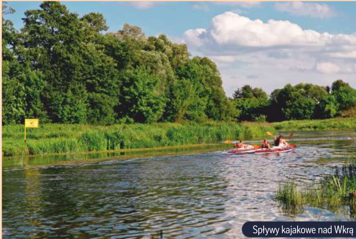
Spływy kajakowe nad Wkrą

Bogatą ofertę zajęć edukacyjno-kulturalnych dla dzieci, młodzieży, dorosłych i seniorów można odnaleźć w Miejsko-Gminnej Bibliotece Publicznej w Nasielsku. Oprócz podstawowej działalności biblioteki, jaką jest wypożyczenie książek, prowadzone są liczne lekcje biblioteczne, spotkania autorskie, zajęcia „Lato w mieście” i „Zima w mieście”. Co roku Biblioteka włącza się do akcji „Cała Polska Czyta Dzieciom”, „Narodowe Czytanie”, „Weekend Seniora z Kulturą”. W obiekcie znajduje się siedziba Nasielskiego Uniwersytetu Trzeciego Wieku, Fundacji „Bądźmy Razem” oraz Poradni Psychologiczno-Pedagogicznej. Dość nową inicjatywą jest Dyskusyjny Klub Książki dla dorosłych oraz dzieci. Placówka tętni życiem przez cały rok.