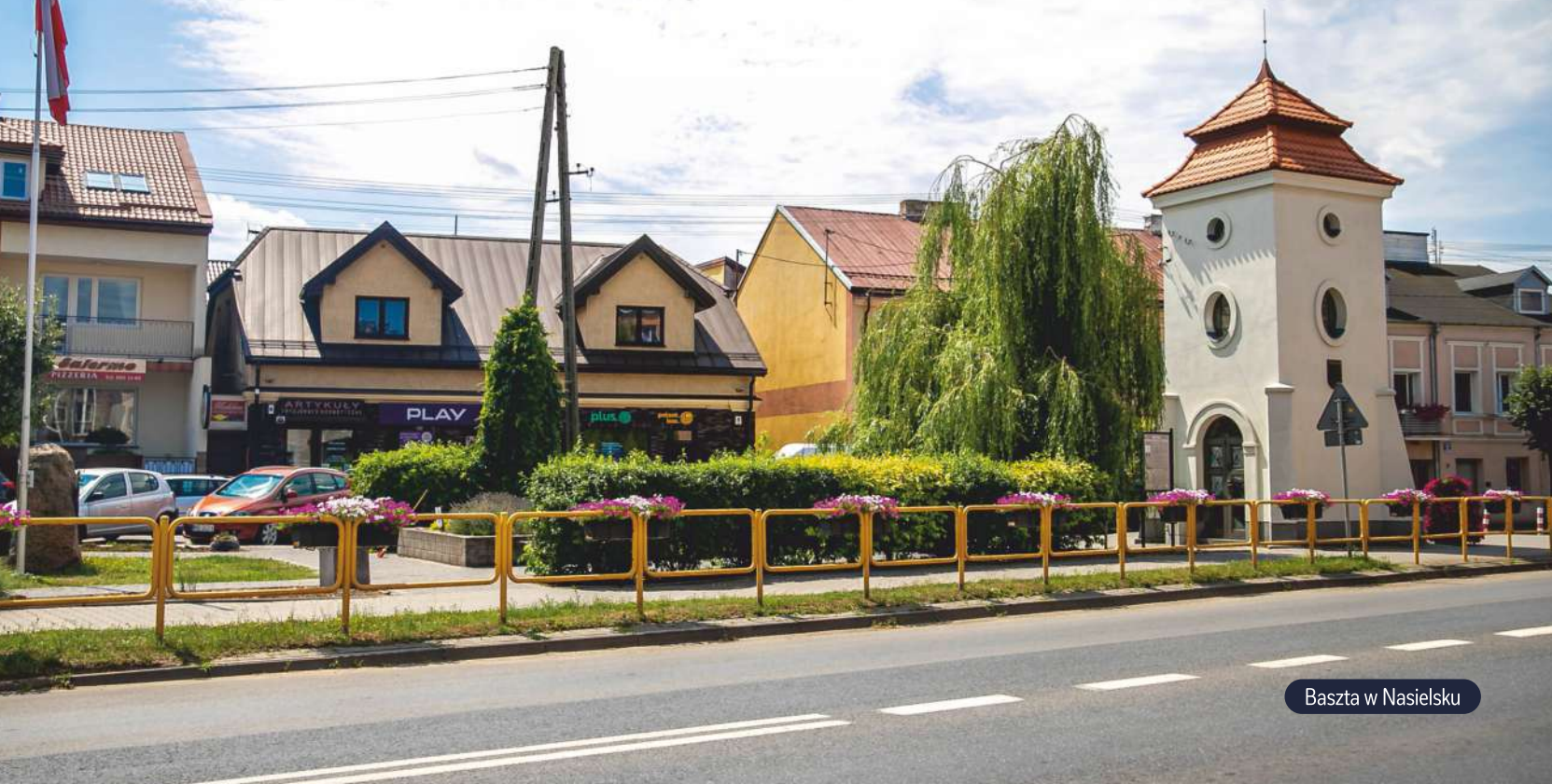
Baszta w Nasielsku

tradycyjne sposoby produkcji wyrobów spożywczych – wędliny, oleje, nalewki czy przetwory, które dostępne są na targowisku przy ul. Tylnej (wtorki, piątki, soboty). Na prawdziwych smakoszy czekają tam także ekologiczne warzywa, owoce czy nabiał. Ponadto we wtorki, piątki i niedziele na terenie targowicy miejskiej przy ul. Lipowej odbywa się handel – można tam kupić ziarna, drób, warzywa i owoce. W centrum miasta znajdują się restauracje czy cukiernie.