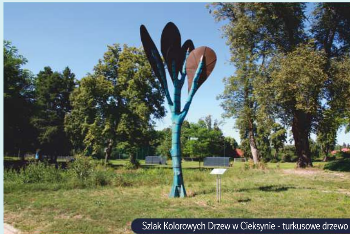
Szlak Kolorowych Drzew w Ciekosynie - turkusowe drzewo