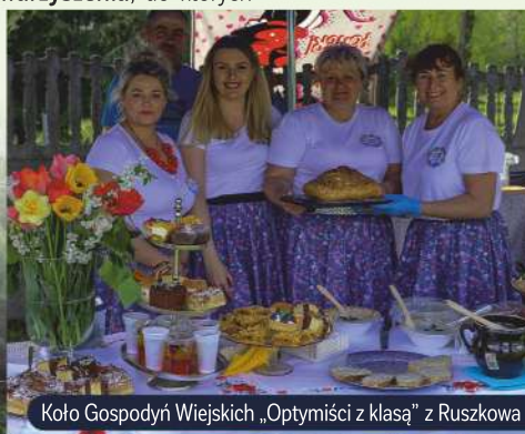
Koło Gospodyń Wiejskich „Optymiści z klasą” z Ruskowa

Fundacja „Bądźmy Razem” i Nasielski Uniwersytet Trzeciego Wieku dbają o aktywizację seniorów w Gminie Nasielsk. Stowarzyszenia , do których zaliczamy m.in.: Stowarzyszenie Artystyczno-Społeczne Skafander, Nasielski Rajd Motocyklowy, Stowarzyszenie na Rzecz Ochrony Zwierząt Nasielsk, Stowarzyszenie „Aktywny i Czysty Nasielsk”, Stowarzyszenie Vox Musicorum czy też Stowarzyszenie Dolina Wkry skupiają wokół siebie ludzi z pasją potrafiących zarażać swoimi zainteresowaniami.