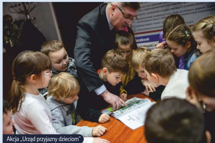
Akcja „Urząd przyjazny dzieciom”

„Urząd przyjazny dzieciom” to akcja, której celem jest zaznajomienie najmłodszych obywateli z tematyką samorządności. Uczniowie placówek oświatowych odwiedzają Urząd Miejski w Nasielsku i dowiadują się m.in. o tym, jak założyć firmę, gdzie złożyć wniosek o dowód osobisty, jak wygląda dron