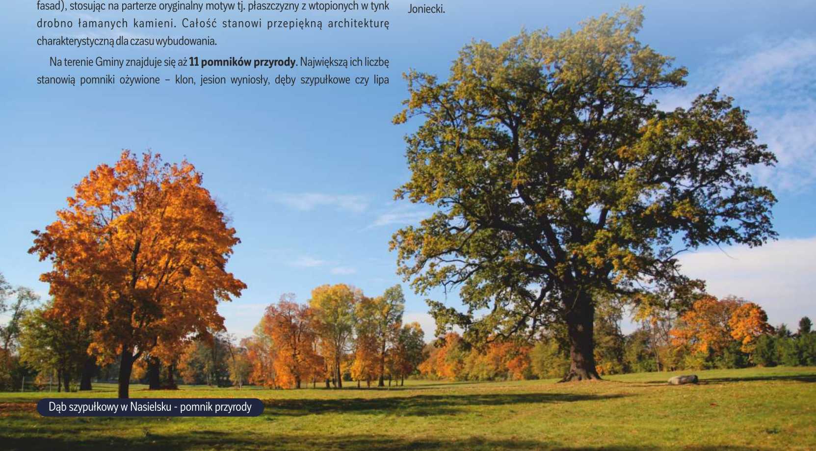
Dąb szypułkowy w Nasielsku - pomnik przyrody

Wartość, różnorodność i atrakcyjność terenów Gminy potwierdzają utworzone obszary chronionego krajobrazu : Nasielsko-Karniewski, Nadwkrzański i Krysko-Joniecki.