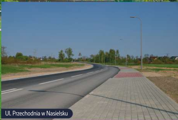
Ul. Przechodnia w Nasielsku