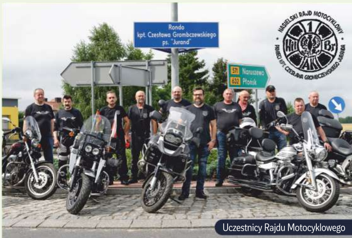
Uczestnicy Rajdu Motocyklowego