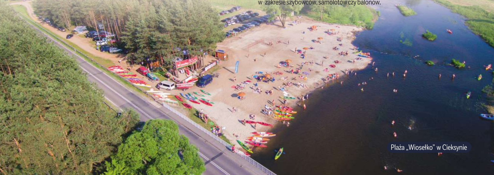
Plaża „Wiosełko” w Ciekosynie

Miłośników mocnych wrażeń zapraszamy na oddalone o ok. 5 km od Nasielska lądowisko w Chrcynnie , gdzie od 1982 r. prężnie działa Aeroklub Warszawski. Odbywają się tam skoki spadochronowe, loty motolotnią, paralotnią oraz sporadycznie loty szybowcem. Na terenie lądowiska znajdują się hangary dla prywatnych małych samolotów czy motolotni oraz odbywają się ćwiczenia pogotowia lotniczego, policji, służb specjalnych czy zawody modeli latających. Aeroklub oferuje także skoki tandemowe, szkolenia spadochronowe AFF oraz w zakresie szybowców, samolotów czy balonów.