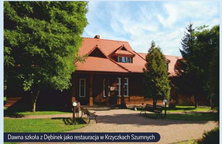
Dawna szkoła z Dębinek jako restauracja w Krzyczkach Szumnych

Nieskażone powietrze, dostępność do zasobów przyrody oraz piękne krajobrazowo tereny wpływają na rozwój agroturystyki, a nie ma nic bardziej relaksującego, jak odpoczynek w kameralnym otoczeniu na łonie natury. Nasielska baza agroturystyczna wyrosła na rolnictwie – 82% powierzchni stanowią użytki rolne – które jest rolnictwem rodzinnym. Rozwój tej gałęzi turystyki pomaga chronić wiejski styl życia i kultywować tradycje. W wielu gospodarstwach zachowane zostały