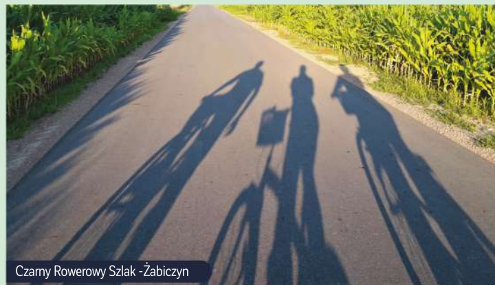
Czarny Rowerowy Szlak - Żabiczyn

„Cztery pory roku nad Wkrą” ( szlak niebieski ) – jeden z najpiękniejszych szlaków na Mazowszu, który w 80% prowadzi ścieżkami i drózkami przez dzikie przyrodniczo, nadwkrzańskie tereny z dala od wielkomiejskiego szumu. Podczas spacerów 18,5-kilometrową trasą można odpocząć na tzw. tarasach nadzalewowych oraz zapoznać się z informacjami dotyczącymi zwiedzanego obszaru znajdującymi się na tablicach edukacyjno-informacyjnych. Wycieczka pieszym szlakiem niebieskim pozostawi niezapomniane wrażenia, nie tylko ze względu na obcowanie wśród nieskażonej ludzką ingerencją natury, ale także ze względu na unikatowe w skali regionu budowle np. zespół dworsko-pałacowy w Lelewie czy pozostałości po starym moście związanym z Bitwą nad Wkrą w 1920 r. To także doskonałe miejsce do nordic walkingu.