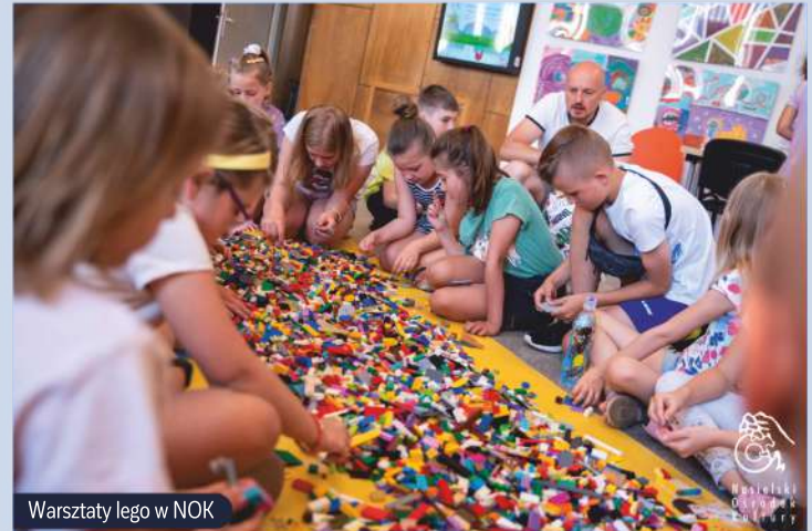
Warsztaty lego w NOK

Nasi mieszkańcy do wyboru mają mnóstwo zajęć dla najmłodszych. Od wczesnych lat dzieci mogą brać udział w zajęciach prowadzonych przez prywatne szkoły językowe czy też zapisać się do klubu sportowego. W Gminie podczas ferii zimowych czy wakacji organizowane są zajęcia dla dzieci : spotkania ze służbami mundurowymi, konkursy, warsztaty plastyczne, komputerowe, malarskie, kreatywne, uwielbiane przez najmłodszych. W każdej części naszej Gminy mamy placówki oświatowe także z oddziałami przedszkolnymi. Łącznie jest to aż osiem szkół podstawowych (w tym jedna niepubliczna). W większości placówki