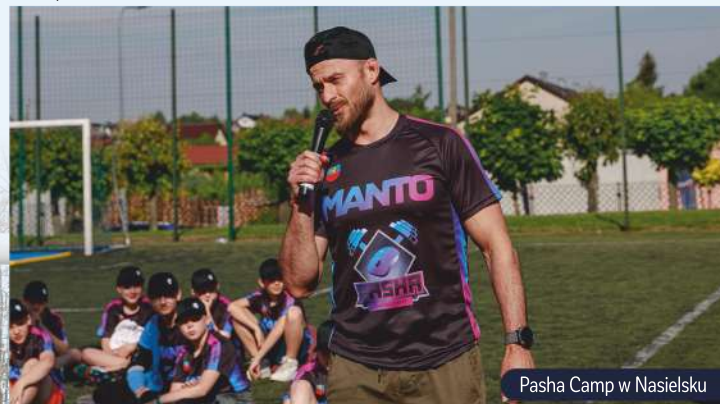
Pasha Camp w Nasielsku