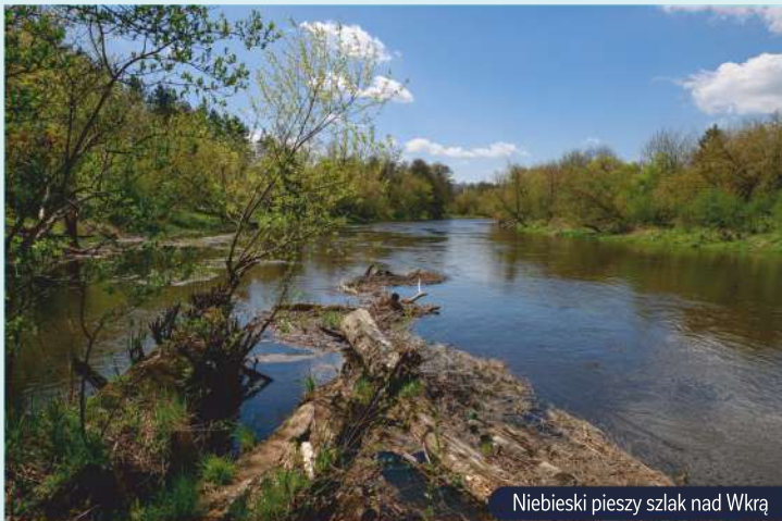
Niebieski pieszy szlak nad Wkrą