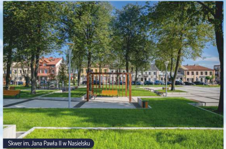
Skwer im. Jana Pawła II w Nasielsku