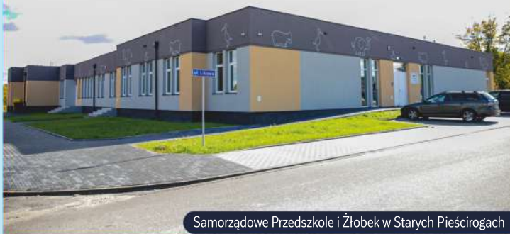
Samorządowe Przedszkole i Żłobek w Starych Pieścirogach