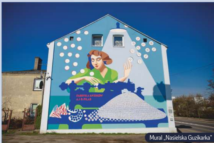
Mural „Nasielska Guzikarka”