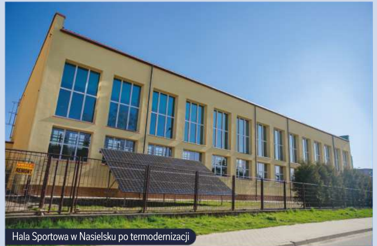
Hala Sportowa w Nasielsku po termmodernizacji

sportowej i dostosowywanie naszych placówek do potrzeb uczniów zmagających się z trudnościami motorycznymi. Kultuwujemy również historię, dbając o zabytki i pamięć o dawnych mieszkańcach naszej Gminy. Restaurowane przez nas zabytki nie tylko zdobywają nagrody za wspaniały architektoniczny styl, ale przede