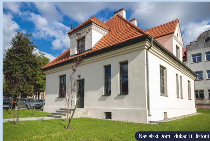
Nasielski Dom Edukacji i Historii

Na terenie Gminy znajduje się aż 11 pomników przyrody . Największą ich liczbę stanowią pomniki ożywione – klon, jesion wyniosły, dęby szypułkowe czy lipa