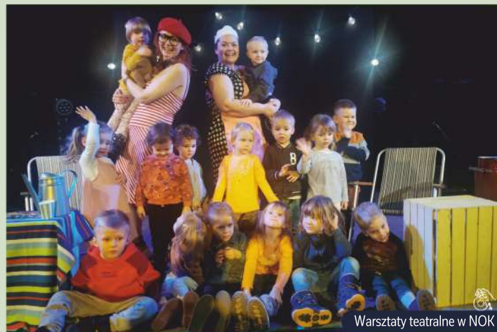
Warsztaty teatralne w NOK

Miejsce do zamieszkania nie może być przypadkowe. To inwestycja, która ma pozwolić znaleźć bezpieczną przystań i azyl przed światem zewnętrznym, ale umożliwić także swobodny kontakt z otoczeniem. Gmina Nasielsk oferuje w zasadzie wszystko, czego potrzeba, by godnie, spokojnie i szczęśliwie żyć. Posiadamy cztery przedszkola (w tym dwa niepubliczne) oraz dwa żłobki miejskie . Nie ma zatem problemu z powrotem mam do pracy po urodzeniu dziecka,