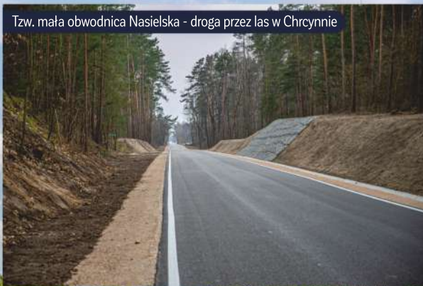
Tzw. mała obwodnica Nasielska - droga przez las w Chrcynnie

Nasza Gmina to przede wszystkim ludzie tworzący wspaniałe społeczności, dlatego wspieramy ich w tworzeniu przestrzeni, która pozwala im zacieśniać więzi i integrować się (np. świetlice wiejskie, miejsca integracji).