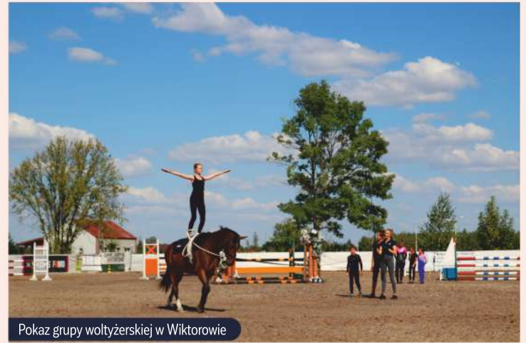
Pokaz grupy wołyżerskiej w Wiktorowie

Tych, którzy cenią sobie bliskość natury, zapraszamy nad Wkrę, która jest jedną z najczystszych rzek na Mazowszu. To typowa rzeka nizinna, o bardzo małym spadku, płynąca leniwie wśród morenowych wzgórz i zielonych łąk. W jej czystym