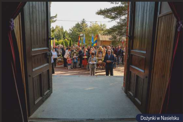
Dożynki w Nasielsku

Wrzesień także otwieramy historią. 1 września co rok upamiętniamy rocznicę wybuchu II wojny światowej. Wiemy, że w tym czasie wszyscy powinniśmy być razem i jednoczyć się w hołdzie tym, którzy dali nam wolność. Następnie mamy Święto Plonów w Nunie, w którym uczestniczą mieszkańcy naszych sołectw. Dożynki co roku oferują atrakcje dla dzieci, koncerty oraz konkurs na najpiękniejszy dożynkowy wieniec. To święto zawsze trwa do późnego wieczoru, a mieszkańcy rozstają się po wspólnej dobrej zabawie przy dźwiękach kapeli.