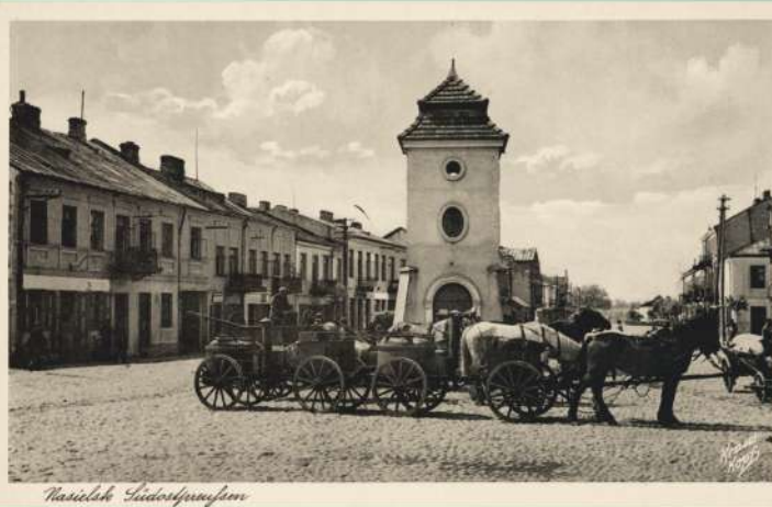
Ulica Kościuszki ok. roku 1940