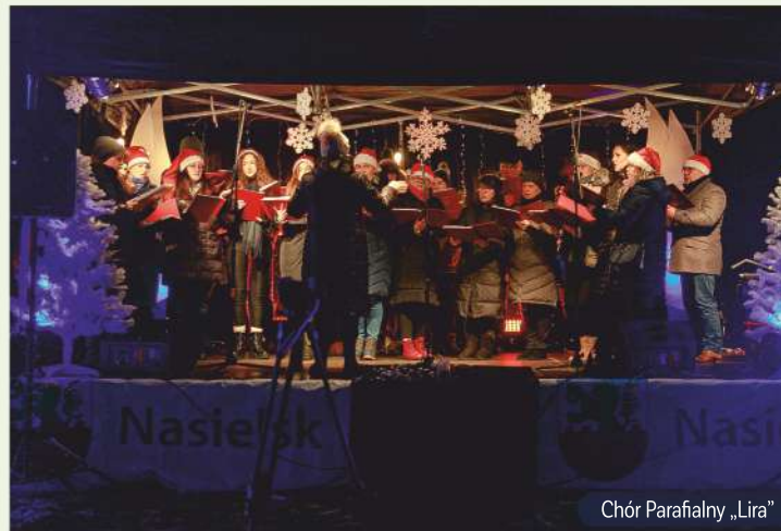
Chór Parafialny „Lira”

Znając swoją wartość na co dzień pielęgnują lokalne tradycje, własne zainteresowania, a także zarażają miłością do pomagania.