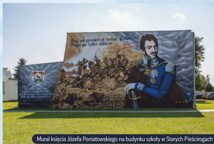
Mural księcia Józefa Poniatowskiego na budynku szkoły w Starych Pieścirogach