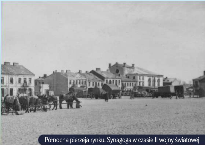
Północna pierzeja rynku. Synagoga w czasie II wojny światowej