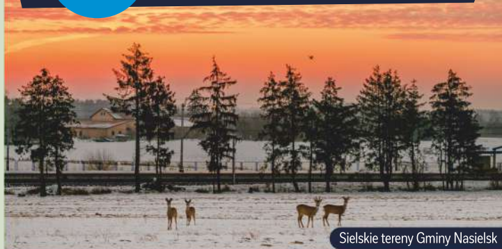
Sielskie tereny Gminy Nasielsk

Miejsce do zamieszkania nie może być przypadkowe. To inwestycja, która ma pozwolić znaleźć bezpieczną przystań i azyl przed światem zewnętrznym, ale umożliwić także swobodny kontakt z otoczeniem. Gmina Nasielsk oferuje w zasadzie wszystko, czego potrzeba, by godnie, spokojnie i szczęśliwie żyć. Posiadamy cztery przedszkola (w tym dwa niepubliczne) oraz dwa żłobki miejskie . Nie ma zatem problemu z powrotem mam do pracy po urodzeniu dziecka,