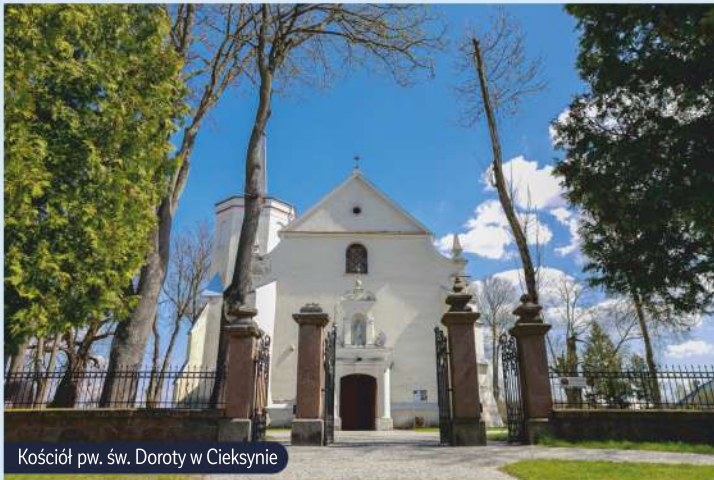
Kościół pw. św. Doroty w Cieksynie

Nieskażone powietrze, dostępność do zasobów przyrody oraz piękne krajobrazowo tereny wpływają na rozwój agroturystyki, a nie ma nic bardziej relaksującego, jak odpoczynek w kameralnym otoczeniu na łonie natury. Nasielska baza agroturystyczna wyrosła na rolnictwie – 82% powierzchni stanowią użytki rolne – które jest rolnictwem rodzinnym. Rozwój tej gałęzi turystyki pomaga chronić wiejski styl życia i kultywować tradycje. W wielu gospodarstwach zachowane zostały