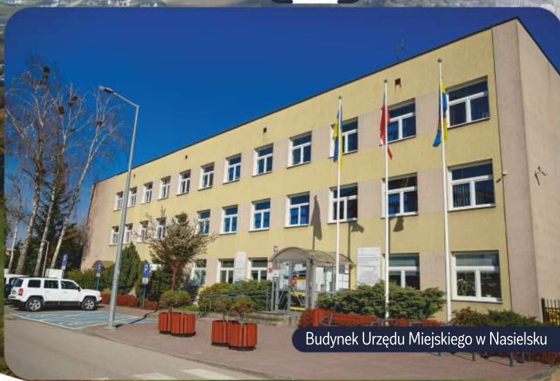
Budynek Urzędu Miejskiego w Nasielsku