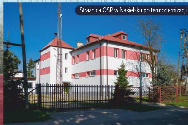
Strażnica OSP w Nasielsku po termomodernizacji

dla dzieci i wychowujących je rodziców. Właśnie dlatego w naszej Gminie powstały dwa nowoczesne przedszkola ze żłobkami , w których pracuje pełna zaangażowania i miłości, opiekuńcza i perspektywiczna kadra. Dzieciom i młodzieży w wieku szkolnym staramy się zapewnić równe szanse poprzez rozwój infrastruktury