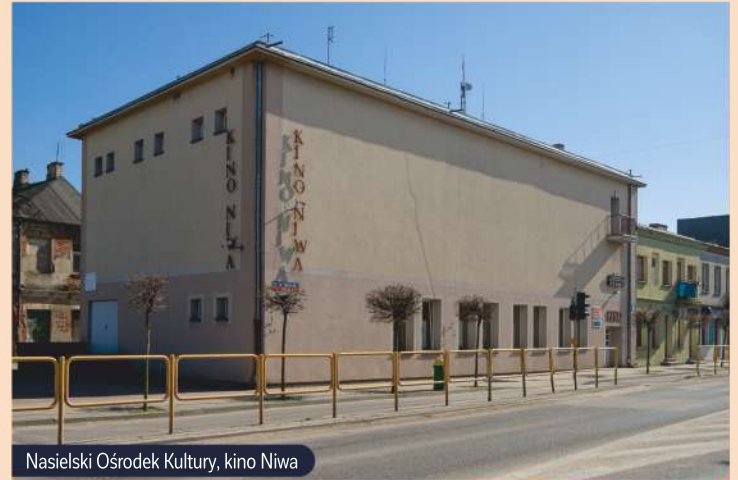
Nasielski Ośrodek Kultury, kino Niwa

Bogatą ofertę zajęć edukacyjno-kulturalnych dla dzieci, młodzieży, dorosłych i seniorów można odnaleźć w Miejsko-Gminnej Bibliotece Publicznej w Nasielsku. Oprócz podstawowej działalności biblioteki, jaką jest wypożyczenie książek, prowadzone są liczne lekcje biblioteczne, spotkania autorskie, zajęcia „Lato w mieście” i „Zima w mieście”. Co roku Biblioteka włącza się do akcji „Cała Polska Czyta Dzieciom”, „Narodowe Czytanie”, „Weekend Seniora z Kulturą”. W obiekcie znajduje się siedziba Nasielskiego Uniwersytetu Trzeciego Wieku, Fundacji „Bądźmy Razem” oraz Poradni Psychologiczno-Pedagogicznej. Dość nową inicjatywą jest Dyskusyjny Klub Książki dla dorosłych oraz dzieci. Placówka tętni życiem przez cały rok.