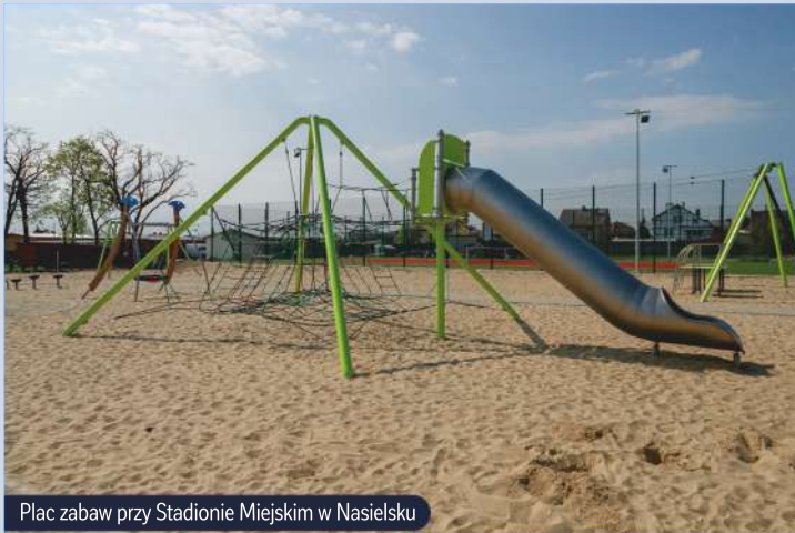
Plac zabaw przy Stadionie Miejskim w Nasielsku

sportowej i dostosowywanie naszych placówek do potrzeb uczniów zmagających się z trudnościami motorycznymi. Kultuwujemy również historię, dbając o zabytki i pamięć o dawnych mieszkańcach naszej Gminy. Restaurowane przez nas zabytki nie tylko zdobywają nagrody za wspaniały architektoniczny styl, ale przede