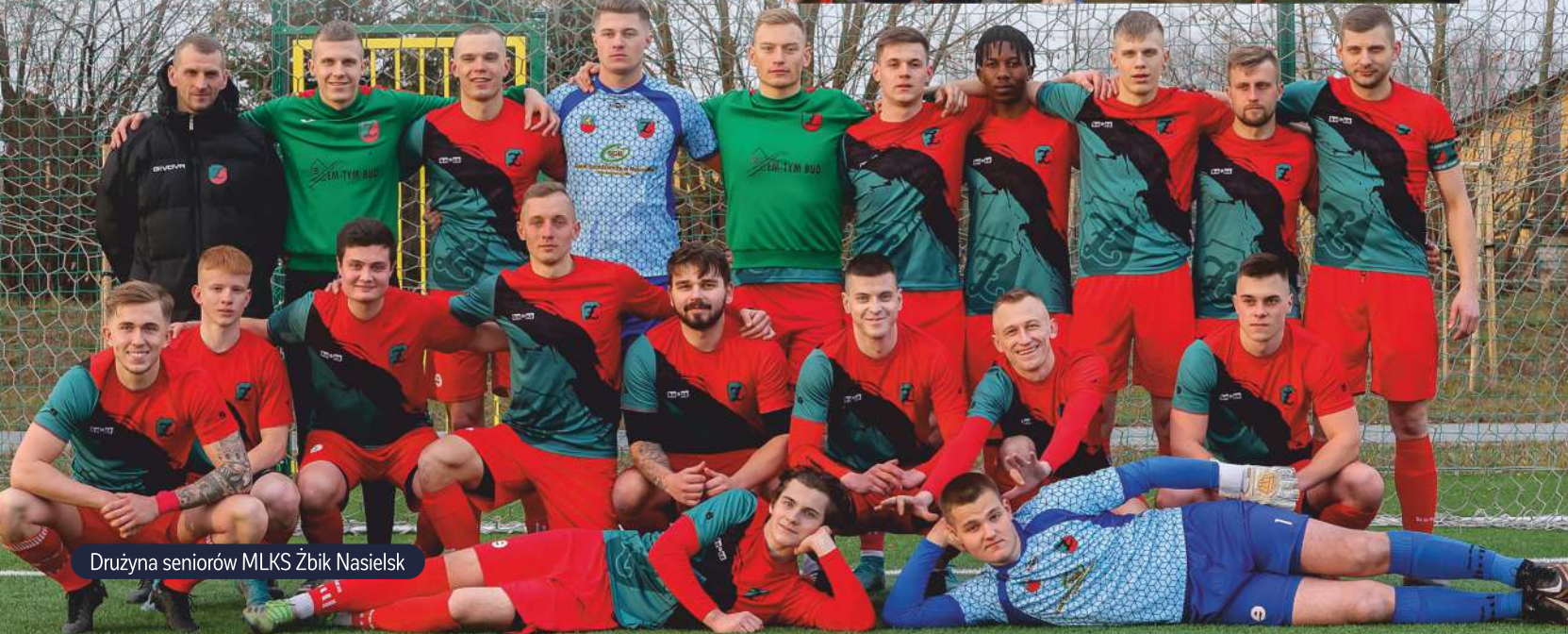
Drużyna seniorów MLKS Żbik Nasielsk