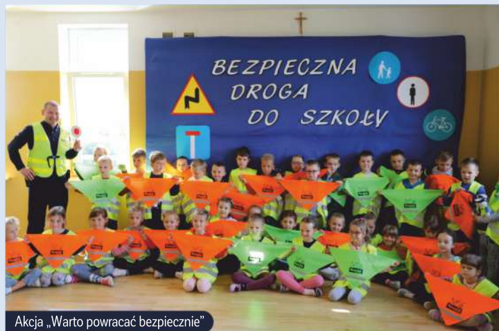
Akcja „Warto powracać bezpiecznie”

Pisząc o naszych cyklicznych wydarzeniach warto także wspomnieć o inicjatywach, które organizujemy z myślą o mieszkańcach: