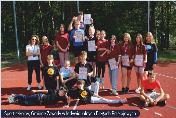
Sport szkolny, Gminne Zawody w Indywidualnych Biegach Przełajowych

Nasi mieszkańcy do wyboru mają mnóstwo zajęć dla najmłodszych. Od wczesnych lat dzieci mogą brać udział w zajęciach prowadzonych przez prywatne szkoły językowe czy też zapisać się do klubu sportowego. W Gminie podczas ferii zimowych czy wakacji organizowane są zajęcia dla dzieci : spotkania ze służbami mundurowymi, konkursy, warsztaty plastyczne, komputerowe, malarskie, kreatywne, uwielbiane przez najmłodszych. W każdej części naszej Gminy mamy placówki oświatowe także z oddziałami przedszkolnymi. Łącznie jest to aż osiem szkół podstawowych (w tym jedna niepubliczna). W większości placówki