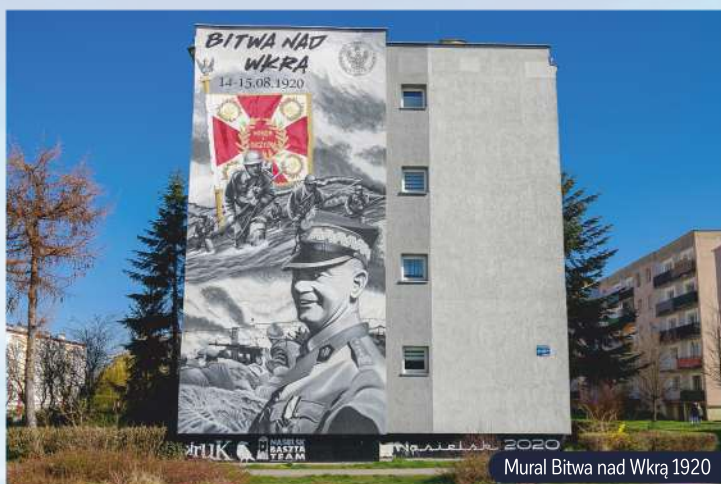
Mural Bitwa nad Wkrą 1920