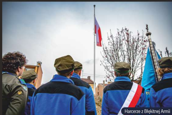
Harcerze z Błękitnej Armii

Październik, mimo coraz gorszej pogody za oknem, to miesiąc bardzo wesoły. Rozpoczyna go inauguracja Nasielskiego Uniwersytetu Trzeciego Wieku, czyli start roku akademickiego naszych seniorów. To ich święto, podczas którego biorą udział w koncertach i wesołej rozrywce. Następnie wszyscy uczestniczymy w Dożynkach w Nasielsku, które podobnie jak Dożynki w Nunie cieszą się ogromną popularnością.