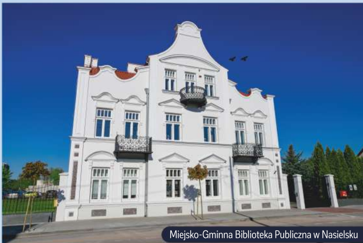
Miejsko-Gminna Biblioteka Publiczna w Nasielsku

Będąc w Nasielsku koniecznie trzeba odwiedzić Miejsko-Gminną Bibliotekę Publiczną , znajdującą się w kamienicy z XX w., która w 2020 r. została oficjalnie wpisana na listę zabytków. W obiekcie można odnaleźć formy nawiązujące do renesansu i baroku (oprawy okien), renesansu polskiego (faliste zwieńczenie fasad), stosując na parterze oryginalny motyw tj. płaszczyzny z wtopionych w tynk drobno łamanych kamieni. Całość stanowi przepiękną architekturę charakterystyczną dla czasu wybudowania.