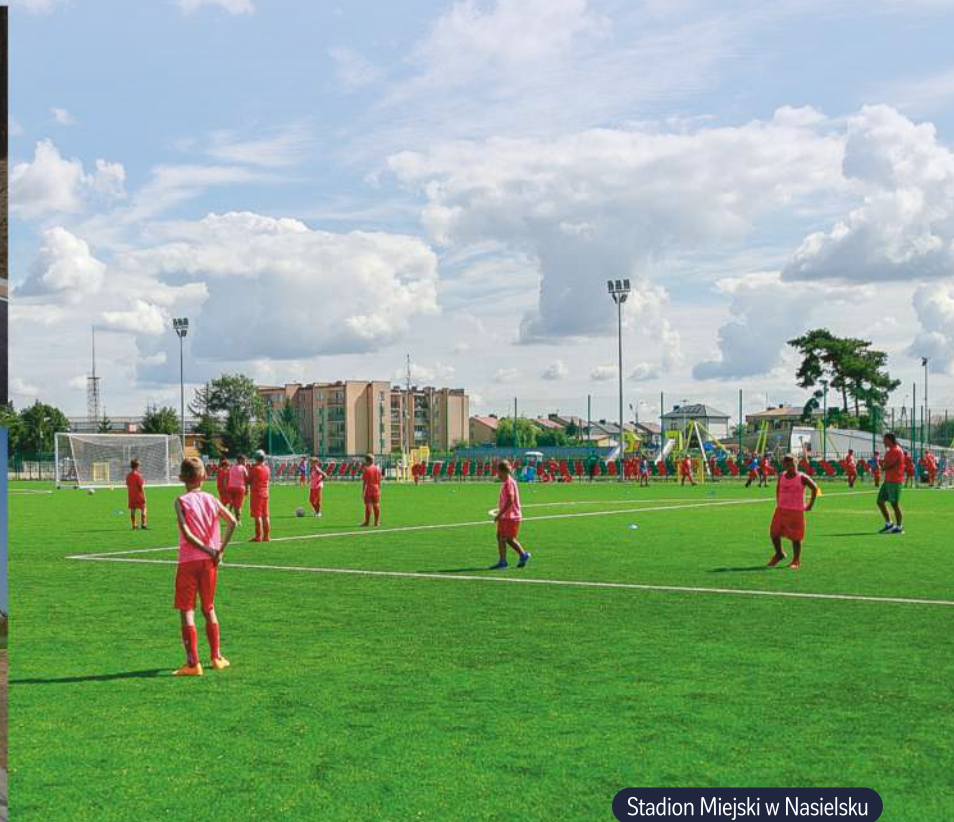
Stadion Miejski w Nasielsku