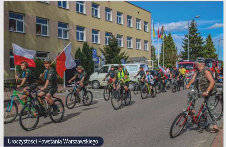
Uroczystości Powstania Warszawskiego

Czerwiec rozpoczynamy Dniem Dziecka. Jest to prawdziwe święto najmłodszych, dzień pełen atrakcji i rozrywki dla najbardziej wymagających mieszkańców naszej gminy. Pikniki, dmuchańce, warsztaty, konkursy, stoiska z zabawkami, koncerty i występy artystyczne to jest to, na co dzieci czekają z utęsknieniem. Prócz tego, czerwiec to także miesiąc nasielskich sportowców-patriotów. W Popowie Borowym od wielu lat organizujemy wydarzenie pod nazwą „Tropem Wilczym. Bieg Pamięci Żołnierzy Wyklętych”. Rozpoczynamy od oddania hołdu bohaterom pod krzyżem. Następnie biegacze rywalizują w wyścigu poprowadzonym częściowo trasami leśnymi, łącząc pamięć historyczną z fizycznym wysiłkiem.