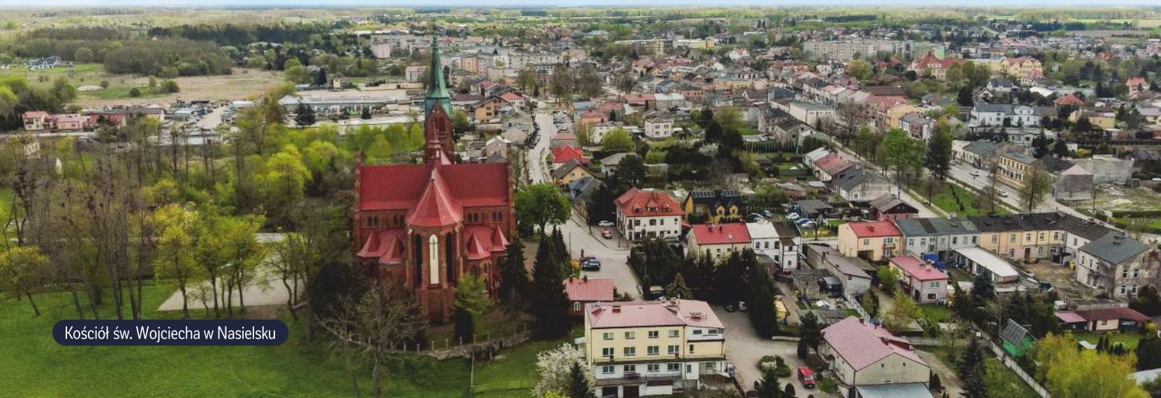
Kościół św. Wojciecha w Nasielsku