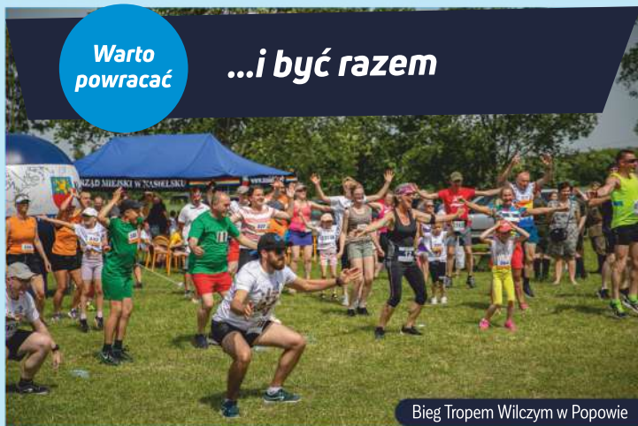
Bieg Tropem Wilczym w Popowie