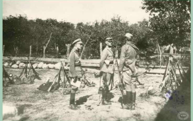
Gen. Władysław Sikorski rozmawia z kawalerzystą i dowódcą pułku przed rozpoczęciem ataku 5. Armii, Borkowo, 14.08.1920 r.