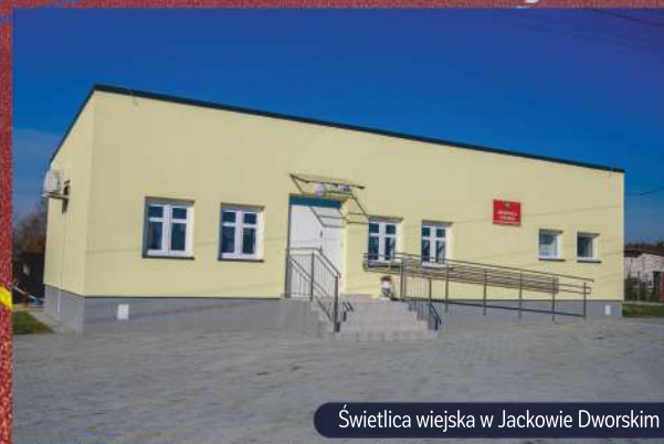
Świetlica wiejska w Jackowie Dworskim