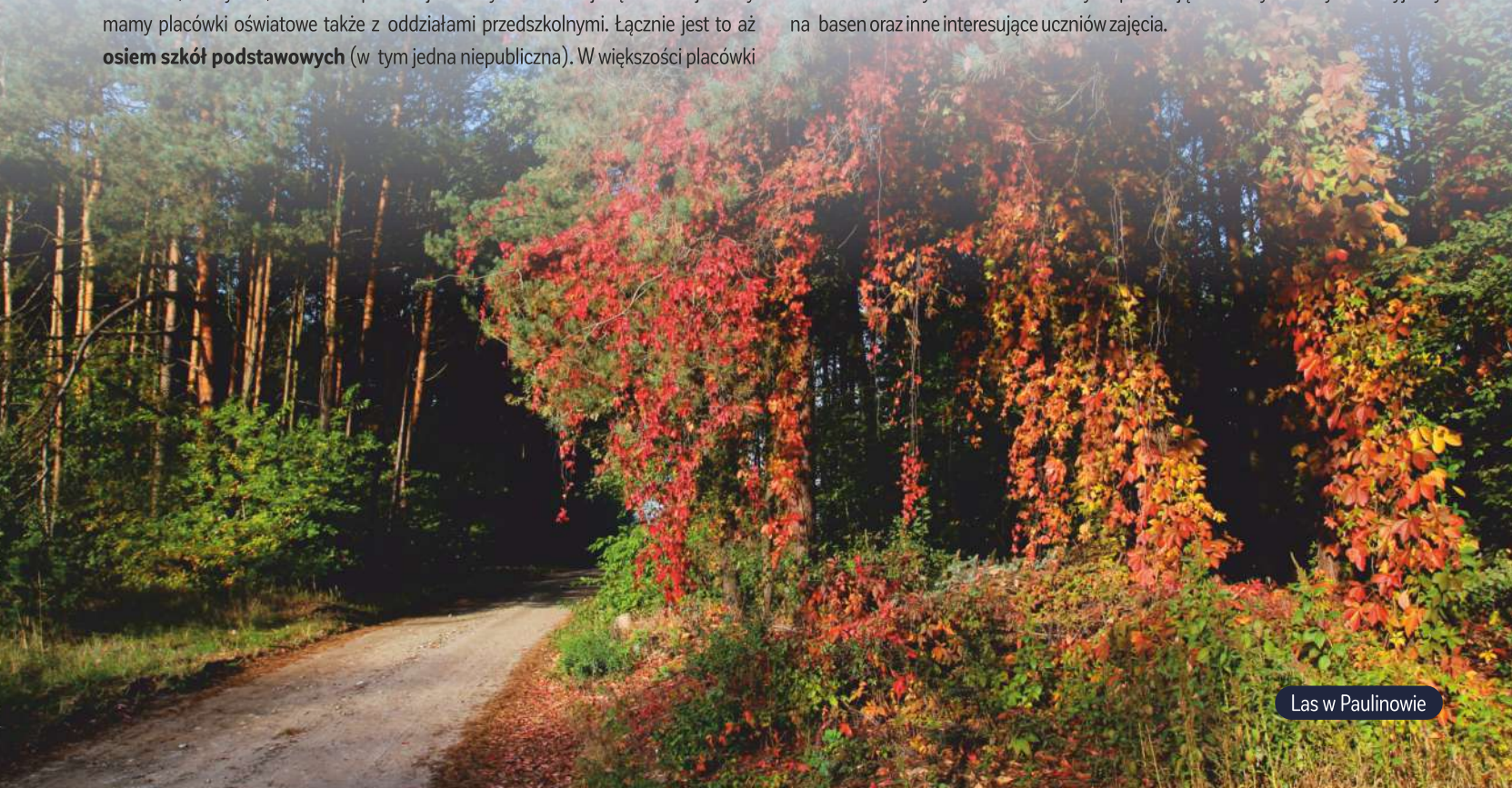
Las w Paulinowie

są przystosowane do potrzeb dzieci ze szczególnymi potrzebami, wyposażone w sale integracji sensorycznej, czy laboratoria przyszłości. Filia Poradni Psychologiczno-Pedagogicznej oferuje specjalistyczną pomoc m.in.: psychologów, pedagogów, logopedów. Dzieci z przyjemnością spędzają czas na kompleksie boisk „Orlik”, siłowniach plenerowych, na placach zabaw oraz boiskach szkolnych. Niektóre szkoły zapewniają także systematyczne wyjazdy na basen oraz inne interesujące uczniów zajęcia.