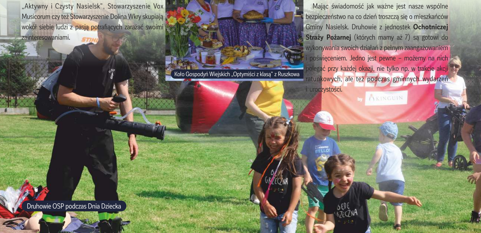
Druhowie OSP podczas Dnia Dziecka

Mając świadomość jak ważne jest nasze wspólne bezpieczeństwo na co dzień troszczą się o mieszkańców Gminy Nasielsk. Druhowie z jednostek Ochotniczej Straży Pożarnej (których mamy aż 7) są gotowi do wykonywania swoich działań z pełnym zaangażowaniem i poświęceniem. Jedno jest pewne – możemy na nich polegać przy każdej okazji, nie tylko np. w trakcie akcji ratunkowych, ale też podczas gminnych wydarzeń i uroczystości.