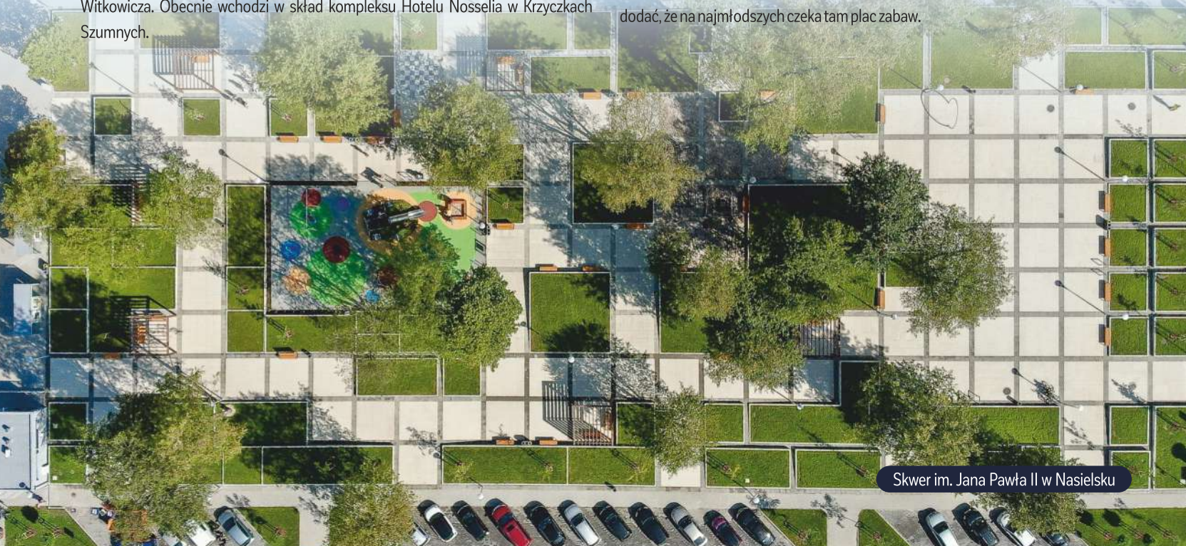
Skwer im. Jana Pawła II w Nasielsku

Sercem Nasielska jest odnowiony w 2023 r. skwer im. Jana Pawła II. To wyjątkowe miejsce, gdzie każdy może odpocząć na ławeczkach pośród zieleni, zagrać w plenerowe szachy, czy też zobaczyć część historyczną skweru. Warto dodać, że na najmłodszych czeka tam plac zabaw.