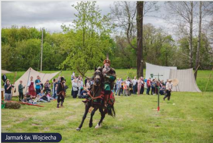
Jarmark św. Wojciecha

Czerwiec rozpoczynamy Dniem Dziecka. Jest to prawdziwe święto najmłodszych, dzień pełen atrakcji i rozrywki dla najbardziej wymagających mieszkańców naszej gminy. Pikniki, dmuchańce, warsztaty, konkursy, stoiska z zabawkami, koncerty i występy artystyczne to jest to, na co dzieci czekają z utęsknieniem. Prócz tego, czerwiec to także miesiąc nasielskich sportowców-patriotów. W Popowie Borowym od wielu lat organizujemy wydarzenie pod nazwą „Tropem Wilczym. Bieg Pamięci Żołnierzy Wyklętych”. Rozpoczynamy od oddania hołdu bohaterom pod krzyżem. Następnie biegacze rywalizują w wyścigu poprowadzonym częściowo trasami leśnymi, łącząc pamięć historyczną z fizycznym wysiłkiem.