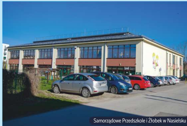
Samorządowe Przedszkole i Żłobek w Nasielsku

W Gminie Nasielsk dbamy o zrównoważony rozwój na całym obszarze i wielu płaszczyznach. Możemy pochwalić się wysokim stopniem zwodociągowania gospodarstw (98%) oraz czterema stacjami uzdatniania wody, których zakres pracy jest stale rozwijany (m.in. poprzez dokonywanie nowych odwiertów np. w Nunie). Nieustannie poszerzamy dostęp do kanalizacji sanitarnej, która odprowadza nieczystości do nowoczesnej oczyszczalni. Dbamy o gminne drogi, próbując stworzyć naszym mieszkańcom i gościom komfortowe warunki do przemieszczania się w każdym kierunku. Pragniemy stwarzać jak najlepsze zaplecze edukacyjne