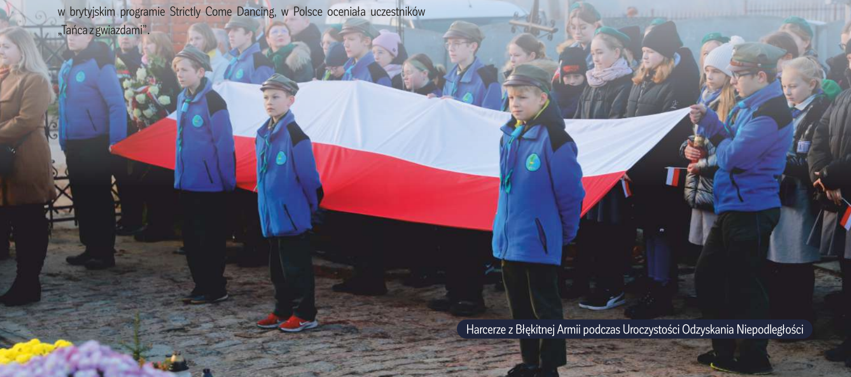
Harcerze z Błękitnej Armii podczas Uroczystości Odzyskania Niepodległości

Pielęgnując wartości patriotyczne oraz mając na uwadze dobro innych udzielają się w harcerstwie. Wśród nasielskich drużyn harcerskich wymienić można: 1. Nasielską Drużynę Harcerzy „Błękitna Armia” im. gen. Józefa Hallera, 1. Nasielską Drużynę Harcerek „Pratum” im. Antoniny Tomaszewskiej, 1. Nasielską Gromadę Zuchenek „Mieszkańcy Zaczarowanej Łąki”, 4. Gromadę Zuchową „Poszukiwacze Żywiółów” oraz 4. Wielopoziomową Drużynę Harcerską „Strażnicy Żywiółów” w Nasielsku, Próbną Gromadę Zuchową „Przyjaciele Mądrej Sowy” w Starych Pieścirogach.