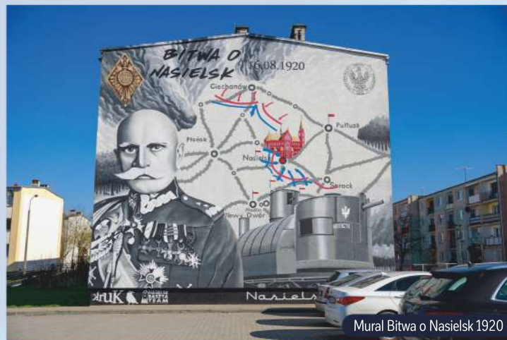
Mural Bitwa o Nasielsk 1920