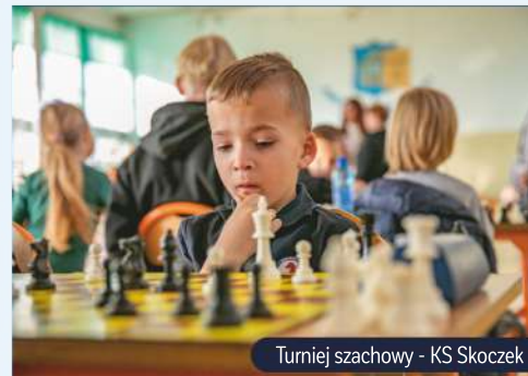
Turniej szachowy - KS Skoczek

„Pasha” Jarząbkowski /pashaBiceps/ gracz e-sportowy w serii Counter-Strike, popularny polski streamer , popularyzator aktywnego trybu życia połączonego z e-sportem.