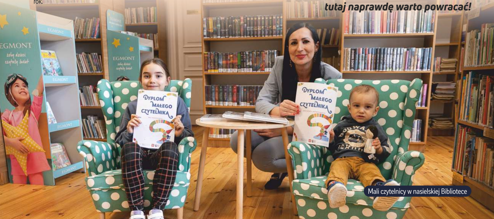
Mali czytelnicy w nasielskiej Bibliotece