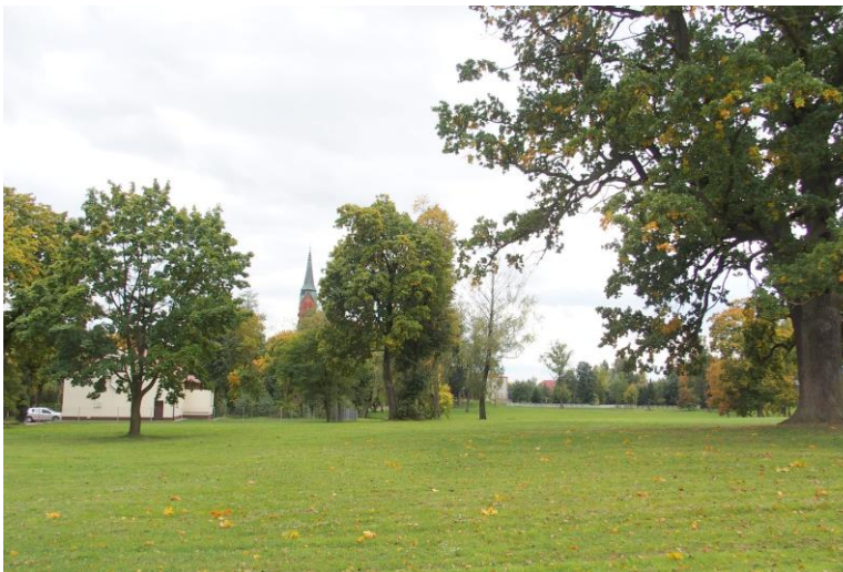
Widok od północnego - wschodu