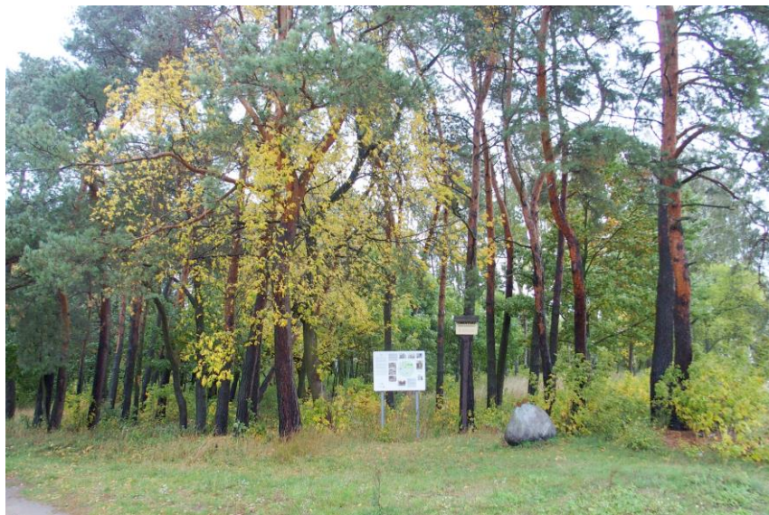
Widok od południowego - zachodu

8. Fotografia z opisem wskazującym orientację albo mapa z zaznaczonym stanowiskiem archeologicznym